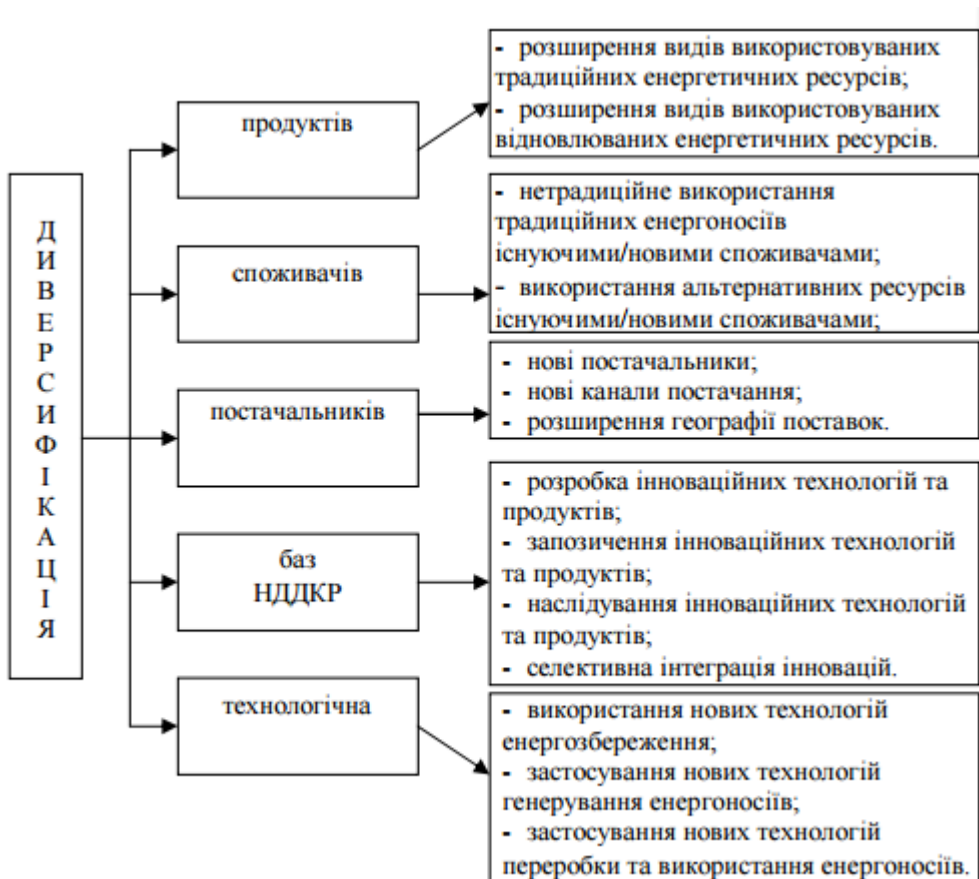
Рис. 3.3 – Напрями енергетичної диверсифікації