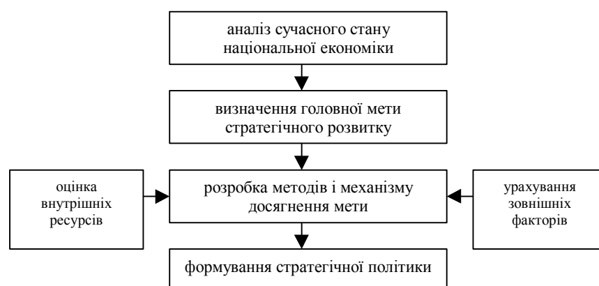
Рис. 1.1. Схема формування національної стратегії економічного розвитку

Реалізація стратегічних цілей досягається звичайно за допомогою таких заходів, як контроль за рівнем цін та доходів; підтримка пріоритетних галузей і компаній; антимонопольна політика; регіональна політика; регулювання валютного курсу; податкова політика та ін.