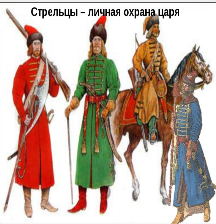
Стрельцы – личная охрана царя