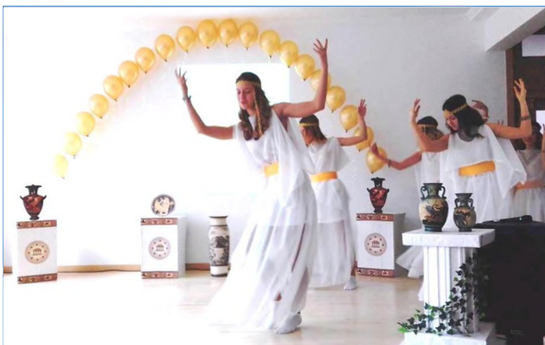
Фото 11. Своеобразный «эпиграф» к конкурсу от невероятно талантливых учеников 27-ой гимназии всем запомнится надолго!

здесь?», или «Цель в жизни... Как же её достичь?» – и так далее. Это удачный ораторский приём : аудитория внемлет ответу! Совет себе: не