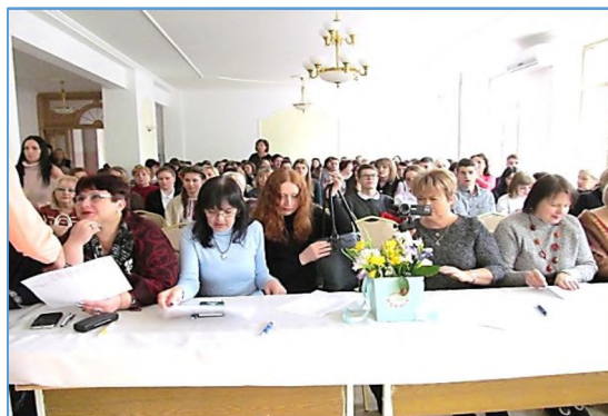
Фото 2. Членам жюри зрители желали «быть беспристрастными, влюблёнными в детей, в искусство говорения, ну и... быть справедливыми»

Представительница моего, Хортицкого, района!! – Горжусь!)