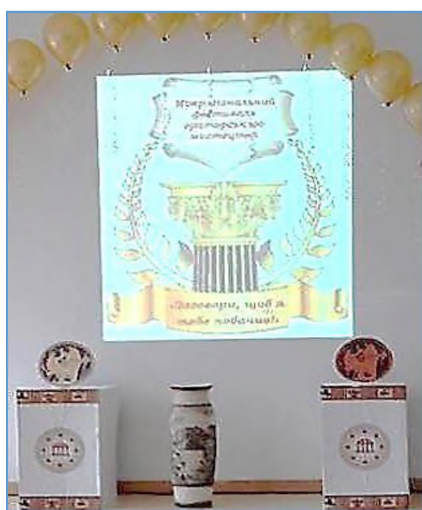
Фото 1. Конкурс для ребят-ораторов проходил на базе 27-ой гимназии, в красивом актовом зале.

Часто в разных странах для обмена информацией создают различные клубы, дискуссионные площадки, шоу , где люди публично высказывают