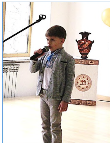
Фото 10. Самый юный оратор среди гостей 3-го конкурсного дня. Артистичный и яркий парень, победивший в своей номинации.