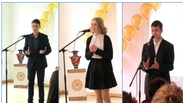
Фото 5-7. Юные ораторы – участники конкурса. Наяву – истинное обаяние и харизма!

...Какими ещё чертами должен обладать оратор? Важен ли, например, внешний вид? Или тембр голоса? По-моему, для оратора – важно учесть всё , здесь мелочей не бывает. Это квинтэссенция! Человек привлекает как внешним видом, так и своим внутренним миром, голосом разума и сердца. Умение привлечь, умение «выкрутиться» (при ответе на трудный вопрос), умение ободрить, взаимодействовать... любить... Любить тех, для кого ты выступаешь, говорить от души – что думаешь, собирая слова «до кучи»... Ты, оратор, – бриллиант, так будь же всегда так же чист и красив, как он!