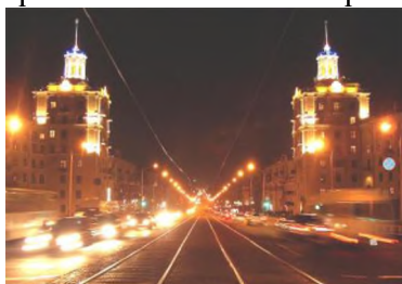
ЗаБор. Ночное Запорожье

... город, удивительно сияющий яркими огнями по вечерам.