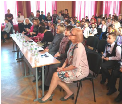
На Міжрегіональному фестивалі «Заговори, щоб я тебе побачив»