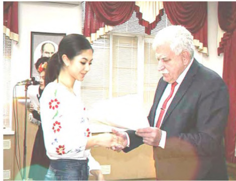
Я отримую нагороду у мовно-літературного конкурсу імені Шевченка обласного етапу (перше місце в обласному етапі)