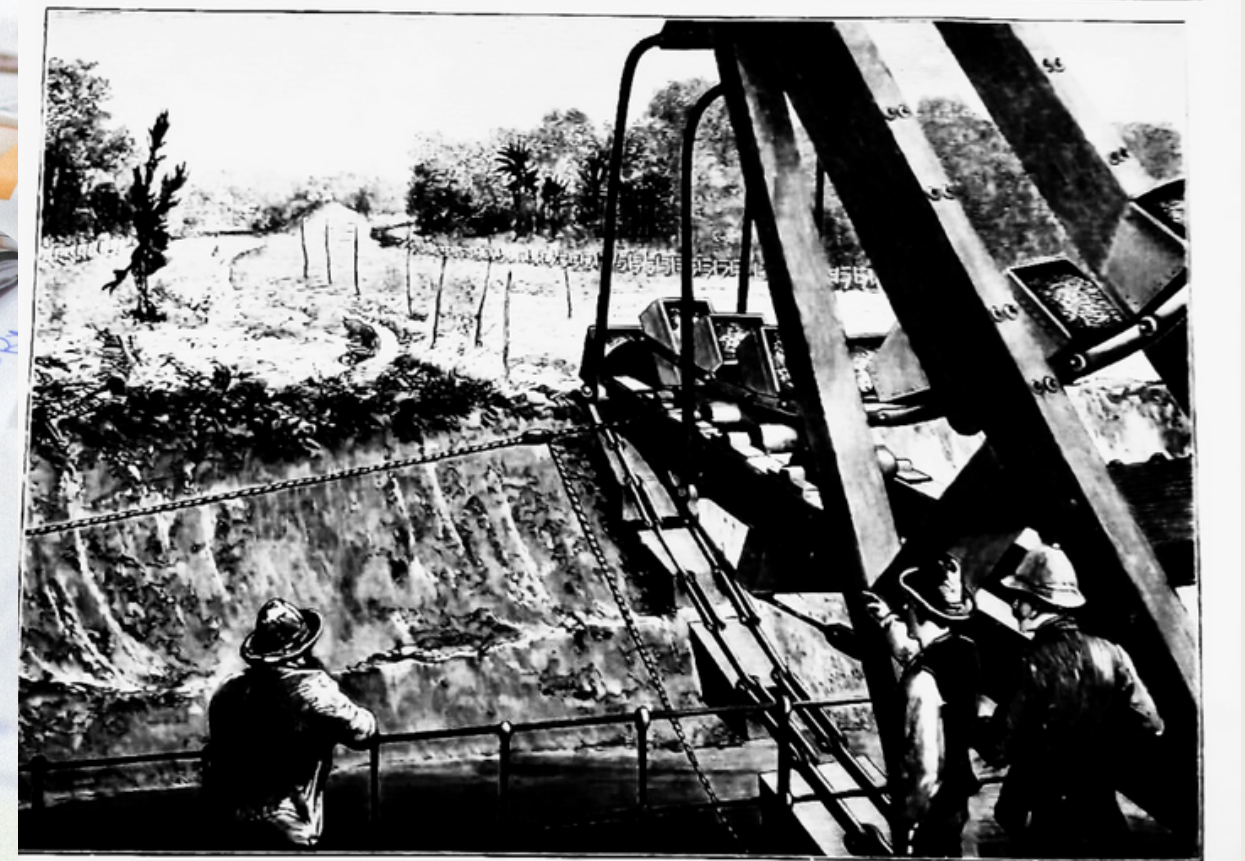
рытія Панамскаго перешейка. Цѣпная землечерпальная машина на пароходѣ. Съ наброска Мельтопа Прайдора въ III. I. N., грав. М. Гамельскій.