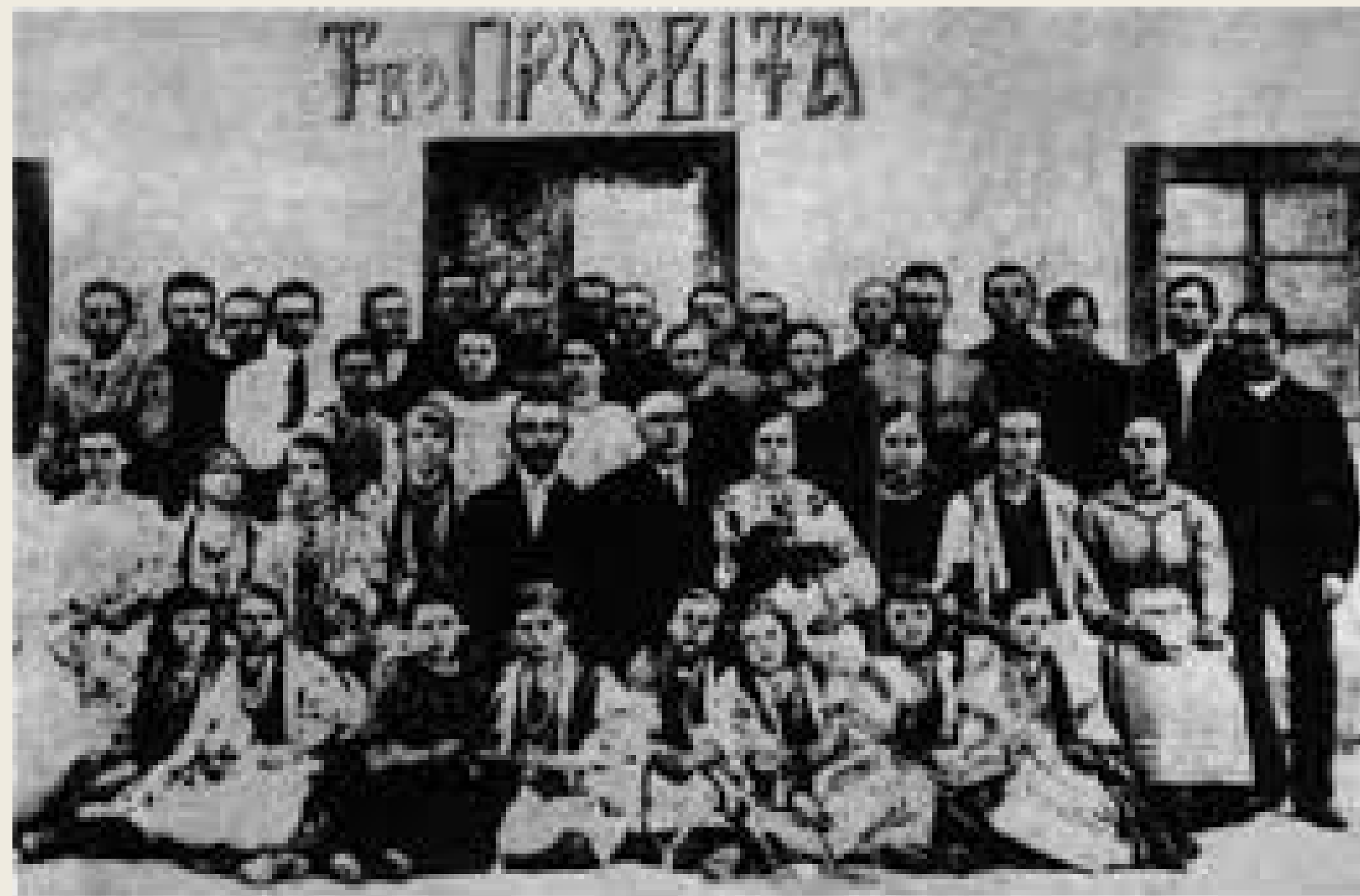
Редакція товариства «Прогвіта», 1868 р.