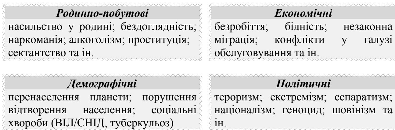
Рисунок 5 — Види соціальних небезпек

Соціальні небезпеки досить численні і різноманітні та можуть бути класифіковані за рядом ознак (рис. 5, 6).