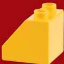
Цеглинка зі скосом