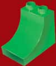
Цеглинка із заокругленням