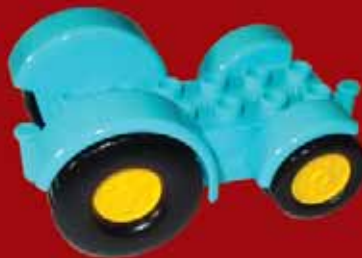
Основа для машини