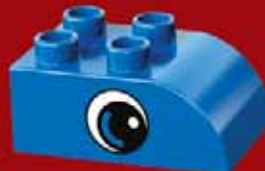
Цеглинка з очима