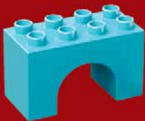
Цеглинка П-подібна або місток