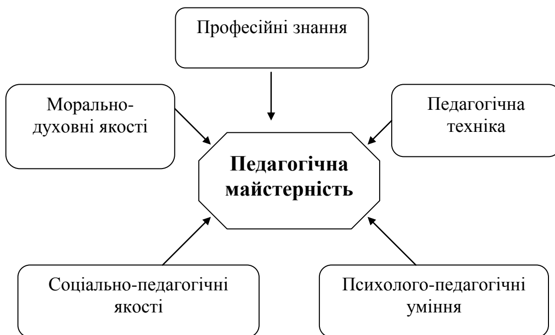
Рис. 19. Компоненти педагогічної майстерності

Педагогічна майстерність включає низку структурних компонентів: морально-духовні вартості, професійні знання, соціально-педагогічні якості, психолого-педагогічні уміння, педагогічну техніку (за А.І. Кузьмінським) (рис.19) [5].