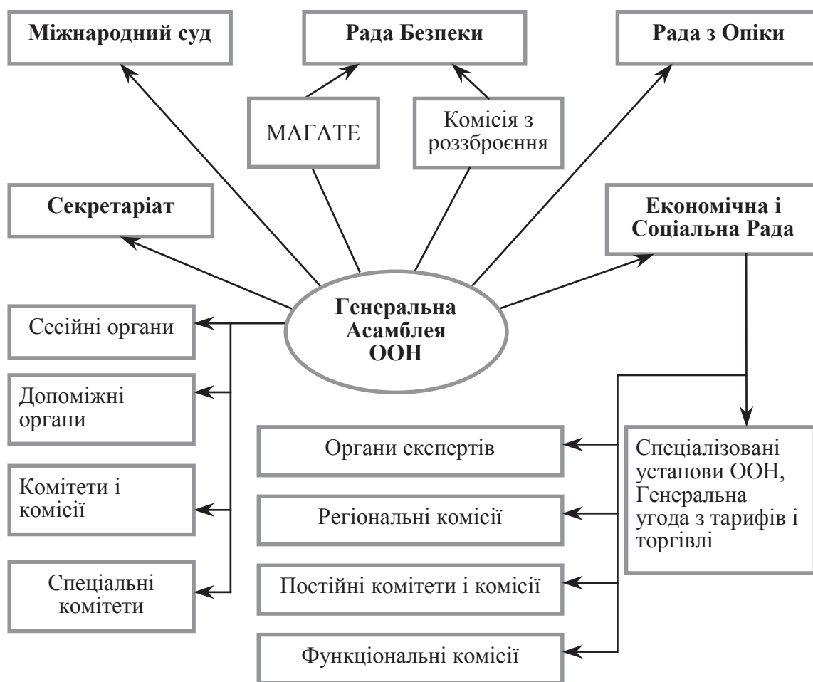
Рис. 2.1. Структурна побудова системи Організації Об'єднаних Націй

4) експертні органи (спеціальна група експертів з міжнародної співпраці з питань оподаткування).