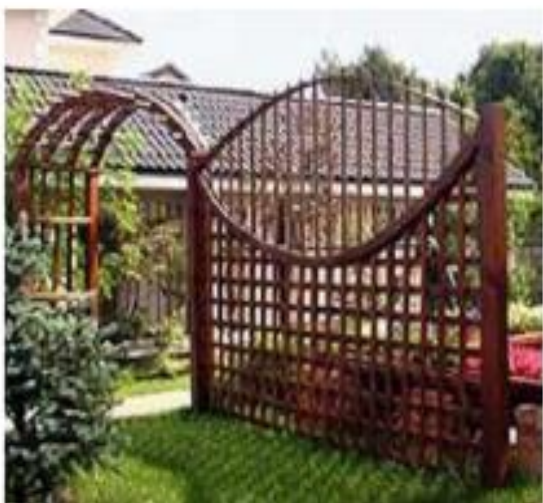
Мал. 9.1.7. Трельяж

Пергола - легке декоративна споруда зі стійок і арок або полуарок з ажурним перекриттям, яке служить опорою для витких рослин (Мал. 9.1.8). Дикий виноград, хміль, капріфоль, плющ, клематиси, гліцинія, в'юнки троянди та інші рослини висаджуються уздовж пергол, близько стійок і заплітають конструкції. Вони утворюють над доріжками та алеями мальовничий тіньовий навіс у вигляді галереї, зеленого коридору, тунелю або затіняють майданчик для відпочинку або її частину.