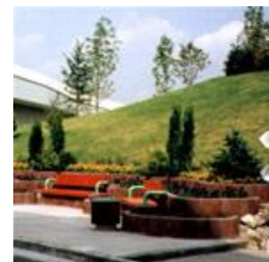
Мал. 9.1.1. Композиції

малих архітектурних форм комплексного благоустрою