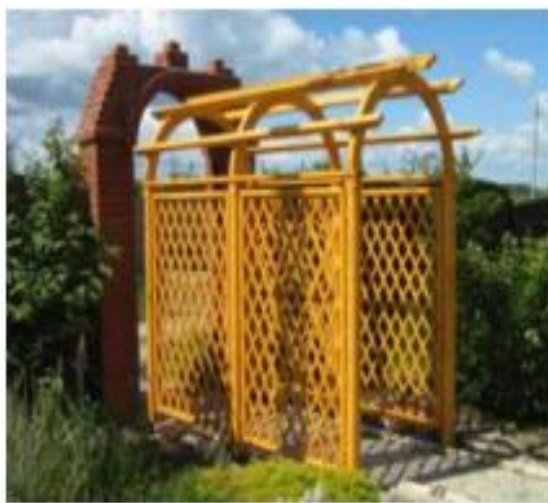
Мал. 9.1.8. Пергола

Высота пергол приймається 2,5–3 м, а ширина – в залежності от интенсивности пешеходного движения (обычно 2–3 м) или необходимости затенения участка территории. Мост или переход создается для сообщения между берегами рек, протоков, каналов, ручьев, оврагов, для обеспечения прохода на острова. В зависимости от назначения мосты могут быть из камня, дерева, реже кирпича, металла.