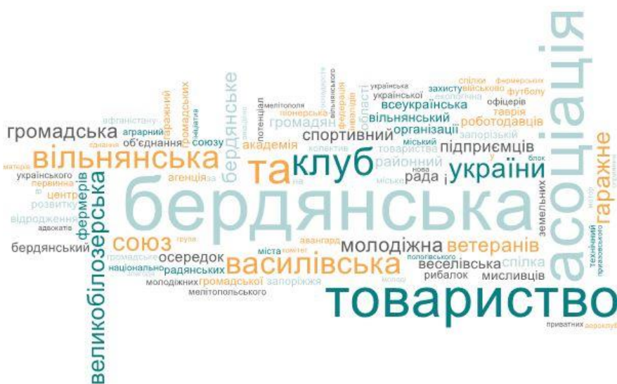
Рис. 5 – Хмара слів з україномовних назв громадських об'єднань Запорізької області

Останнім етапом аналізу став процес візуалізації найбільш вживаних у назвах громадських організацій термінів, коротше говорячи, побудова хмари понять. Так, було побудовано дві хмари – одна з україномовних термінів, друга – англійськомовних (див. рис. 5-6).