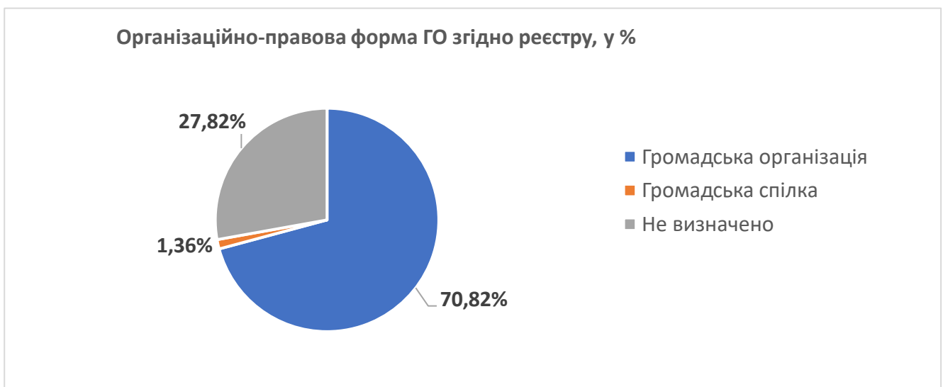
Рис. 3. – Організаційно-правова форма громадських об'єднань Запорізької області згідно реєстру

Особистий стан громадських організацій налічує 90,91% зареєстрованих. Це дає підставу вважати, що на сьогодні дуже багато громадських організацій проводять свою діяльність. За змінною «статус юридичної особи» 84,17% громадських організацій мають статус юридичної особи та 15,83% знаходяться без статусу юридичної особи.