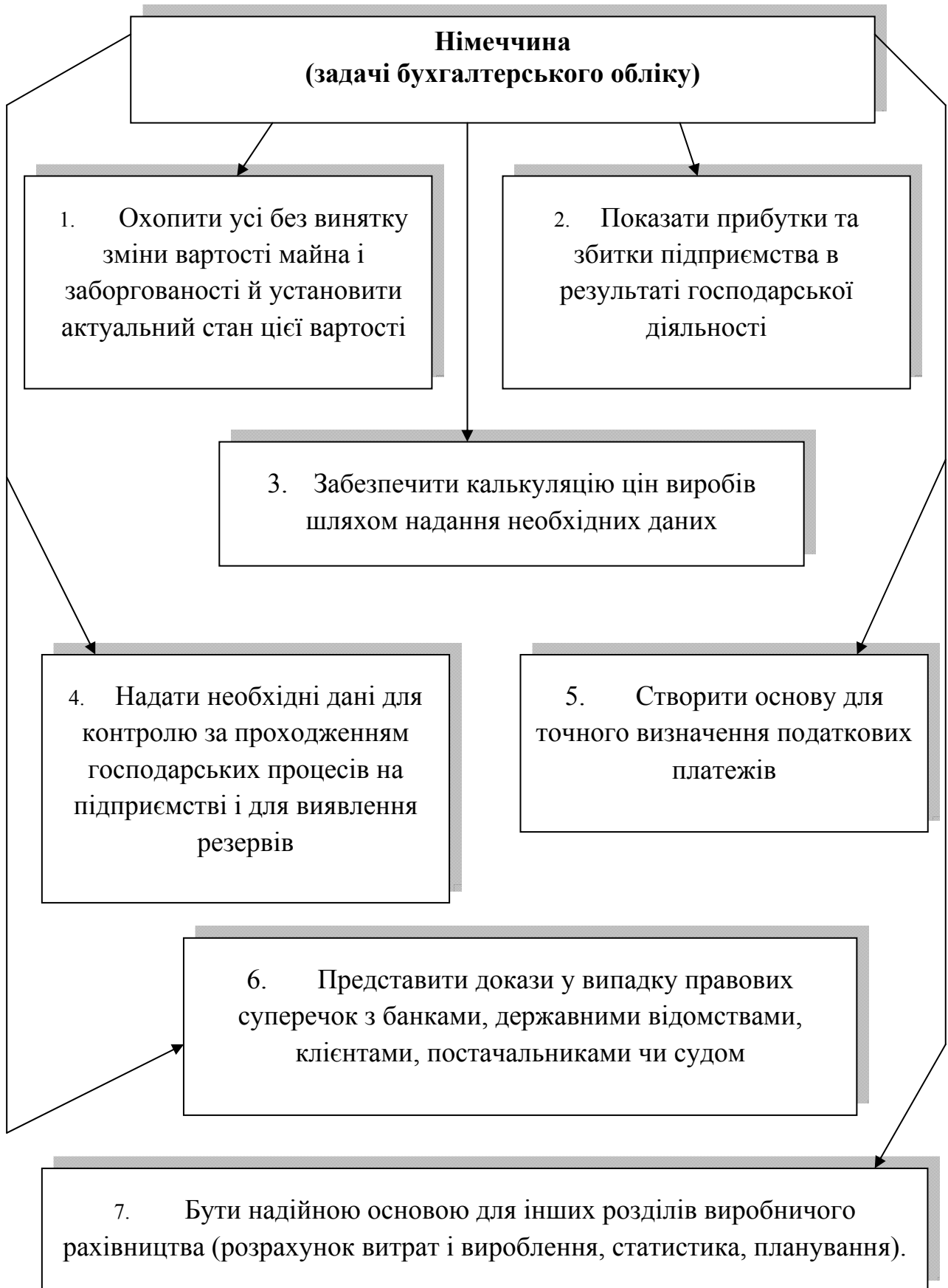
Рисунок 1.4 - Задачі бухгалтерського обліку у Німеччині