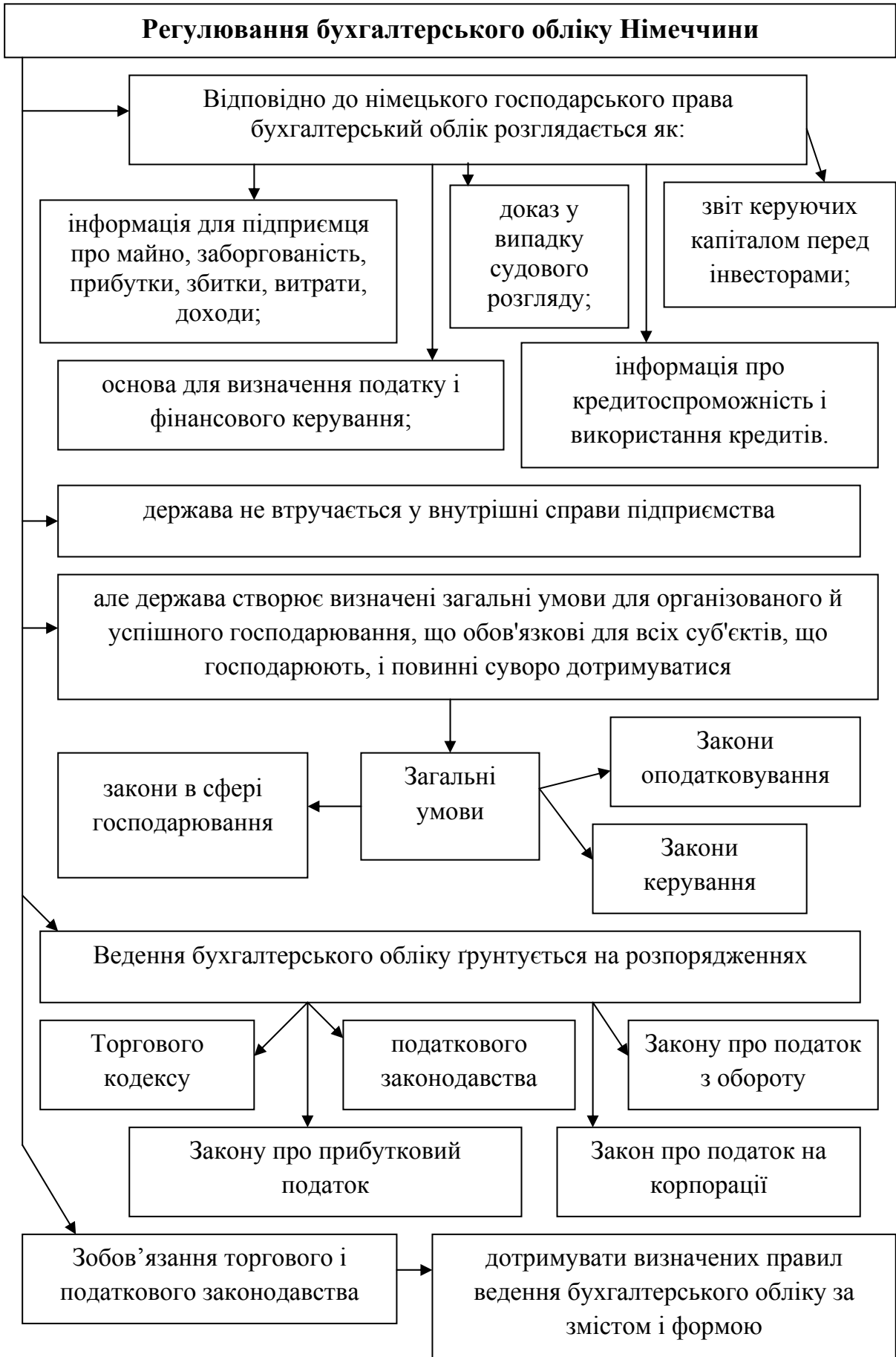
Рисунок 1.6 - Регулювання бухгалтерського обліку Німеччини