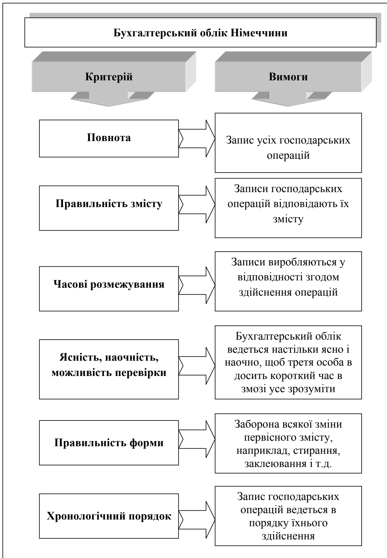
Рисунок 1.5 - Вимоги до бухгалтерського обліку в Німеччині