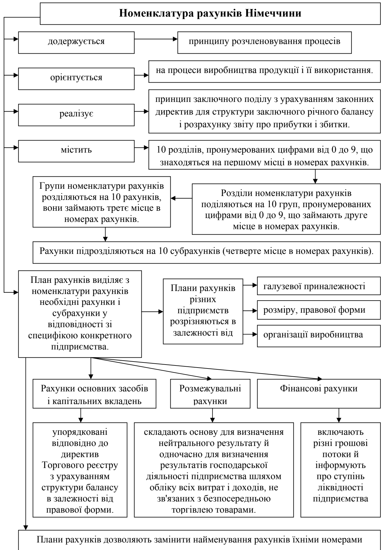
Рисунок 1.8 - Номенклатура рахунків Німеччини