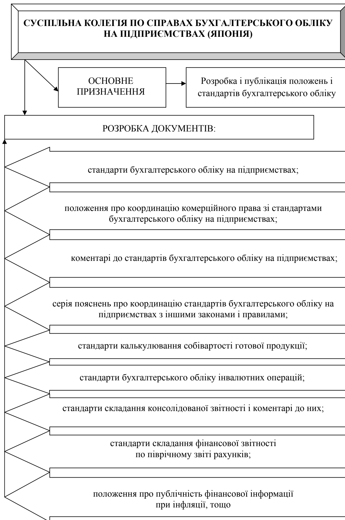
Рисунок 1.1 – Структура та зміст діяльності Суспільної колегії