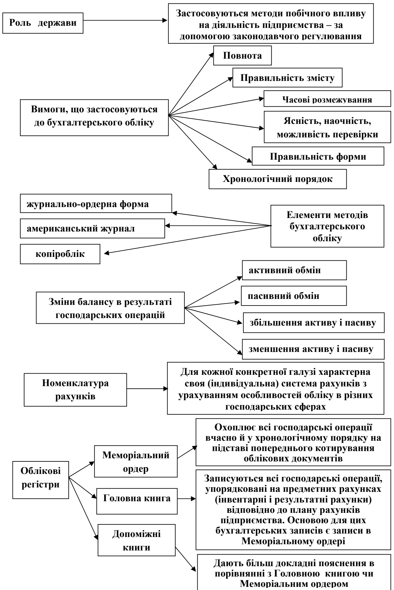
Рисунок 1.7 - Схема особливостей бухгалтерського обліку в Німеччині