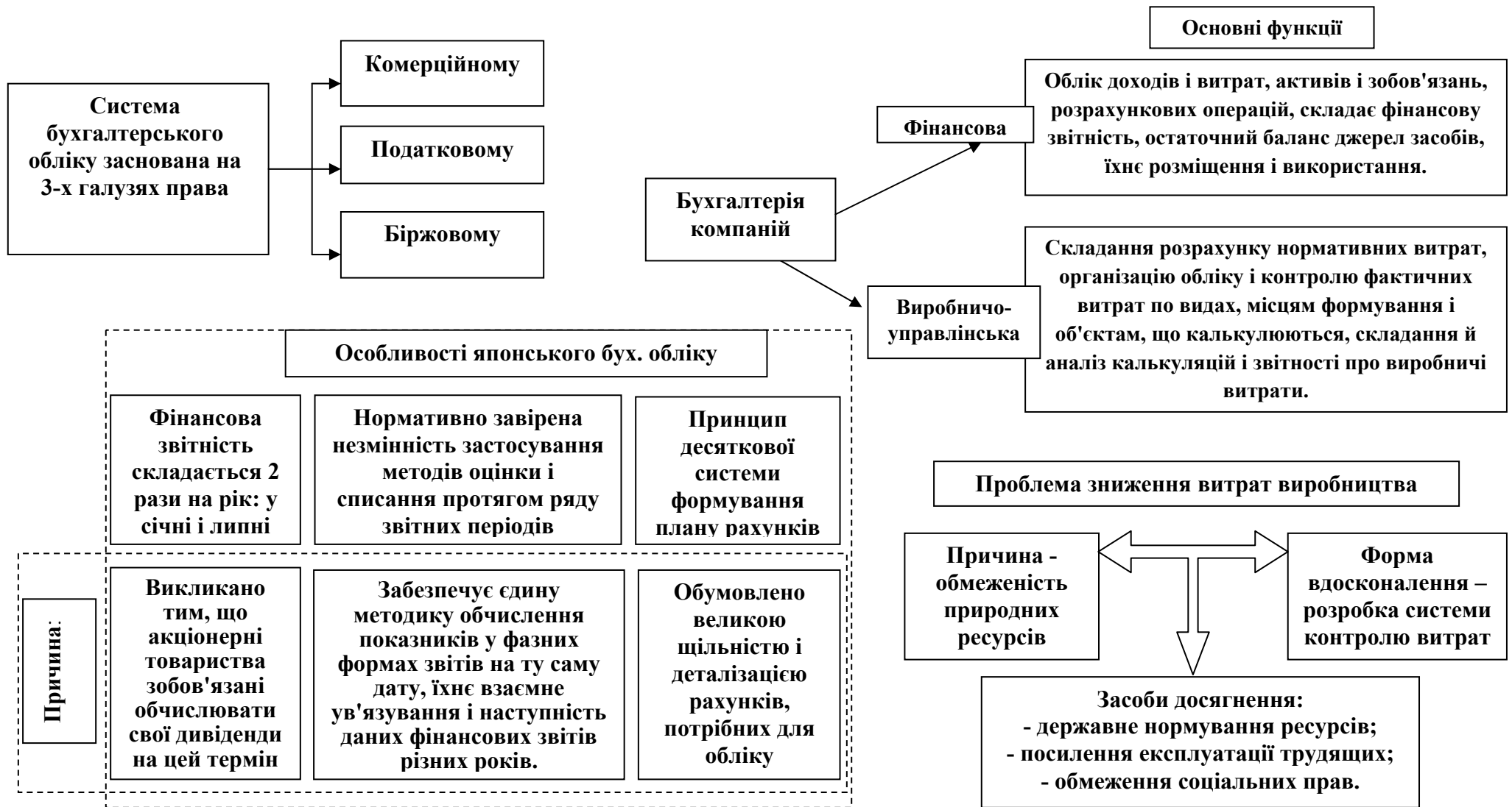
Рисунок 1.2 – Характерні риси японського бухгалтерського обліку