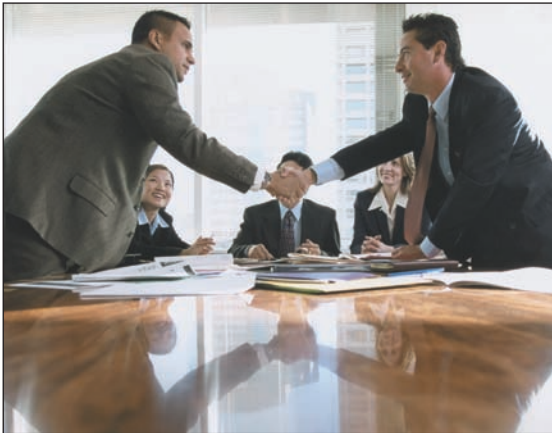
Fig. 2.6. Al estrechar la mano debemos hacerlo de forma firme y breve.

presento a mi marido», «mi mujer», etc. Debemos huir siempre de expresiones como «señora». Hay que dirigirse a las personas por su nombre y nunca por pronombres demostrativos como éste/a , ése/a o aquél y aquella .