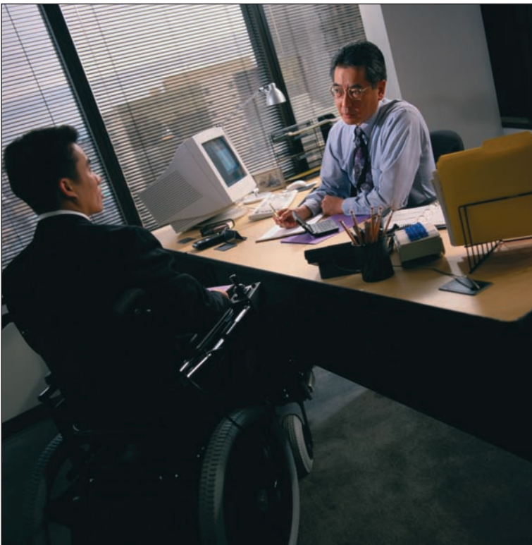
Fig. 2.4. Durante la entrevista debemos mostrar seguridad en nosotros mismos.