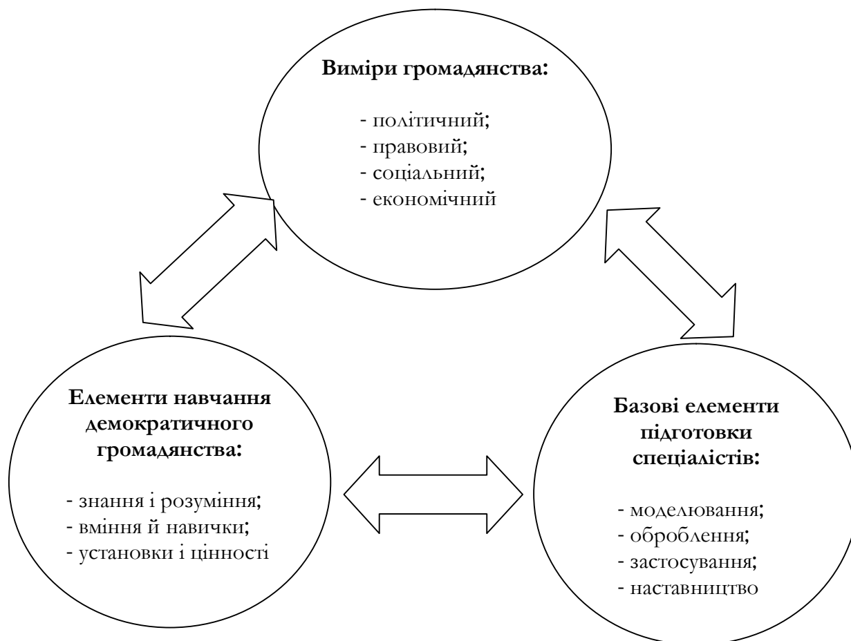
Дидактична модель ОДГ