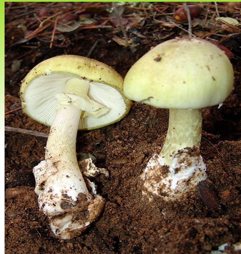
Бліда поганка - найнебезпечніший гриб в українських лісах