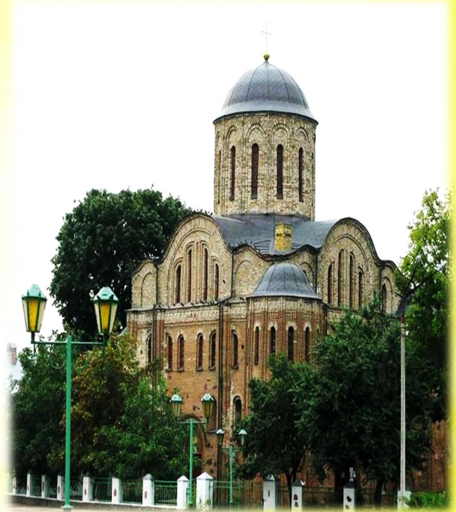
Один з найдревніших храмів України - Свято-Василівський собор у Овручі

* На нові реалії духовного життя народу, державно-церковних і міжконфесійних взаємин Верховна Рада України відреагувала ухваленням 23 квітня 1991 р. Закону України «Про свободу совісті та релігійні організації». Проте державну політику щодо релігії й церкви Україна змогла здійснювати лише після остаточного здобуття незалежності. Насамперед наша держава відмовилася від тоталітарних методів впливу на віруючих і церковні організації, стала на шлях розбудови цивілізованих і демократичних державно-церковних взаємин.