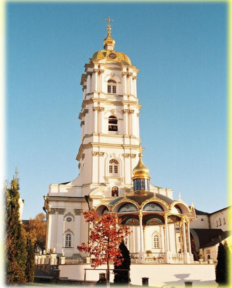
Почаївська лавра, дзвінниця