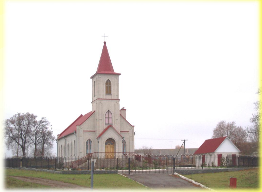
Ружин, протестантська церква

* Протестантизм в Україні представлено 33 напрямками. Питома вага протестантських громад останніми роками динамічно зростає й становить вже понад чверть релігійної мережі країни. Водночас збільшується число громад мусульман, іудеїв, а також новітніх, нетрадиційних релігійних течій (на жаль, досить часто згубних для душевного та фізичного здоров'я людини).