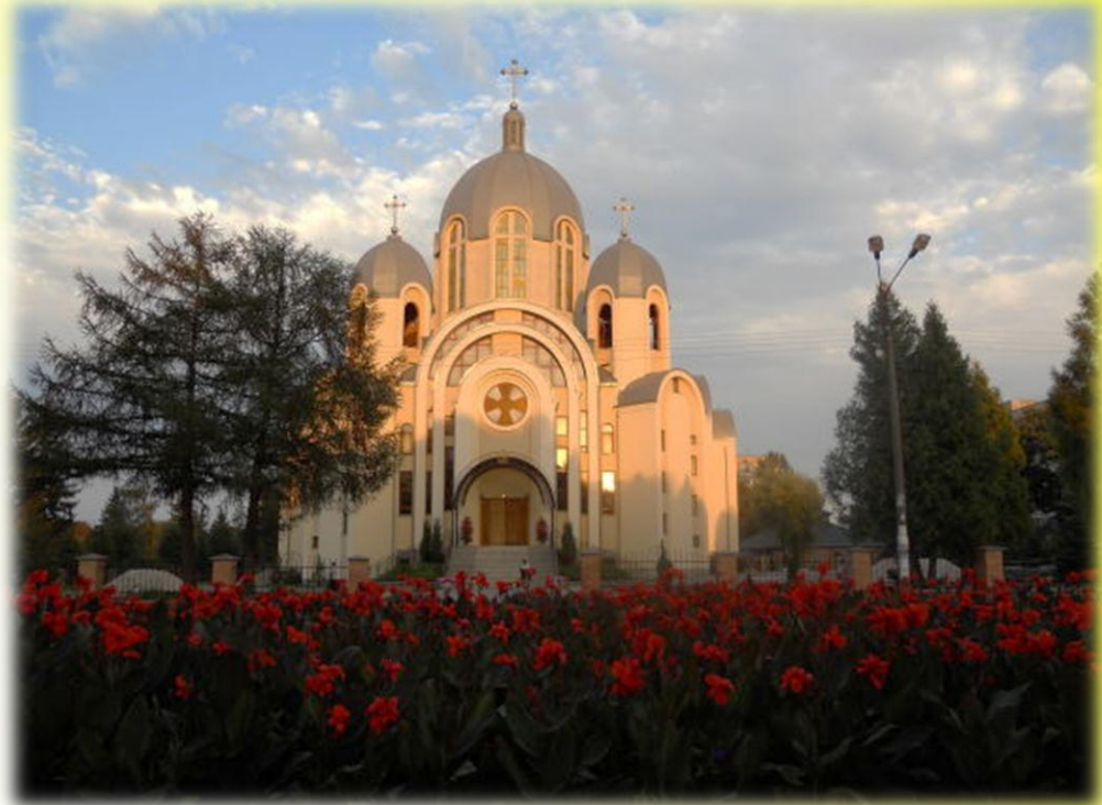
Тернопіль, греко-католицька церква

* Дістали можливість легалізувати свою діяльність раніше заборонені владою Українська греко-католицька (інша назва — Українська католицька) і Українська автокефальна православна церкви, численні протестантські течії. За роки незалежності вірянам повернули 3 400 храмів, відібраних у них свого часу радянською адміністрацією, збудовано 2 600 нових церков, костьолів, молитовних будинків.