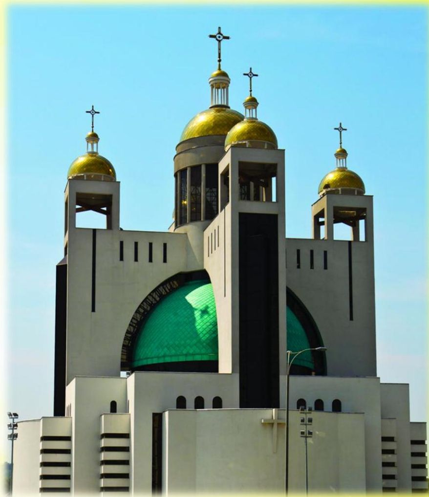
Собор Воскресіння Христового УГКЦ