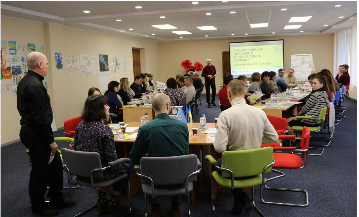
У громаді створено зручний (у т.ч. для людей із інвалідністю) мультифункціональний публічний простір для проведення тренінгів, семінарів, зустрічей влади з громадськістю: чергова зустріч, на якій влада разом з мешканцями працює над розбудовою громади