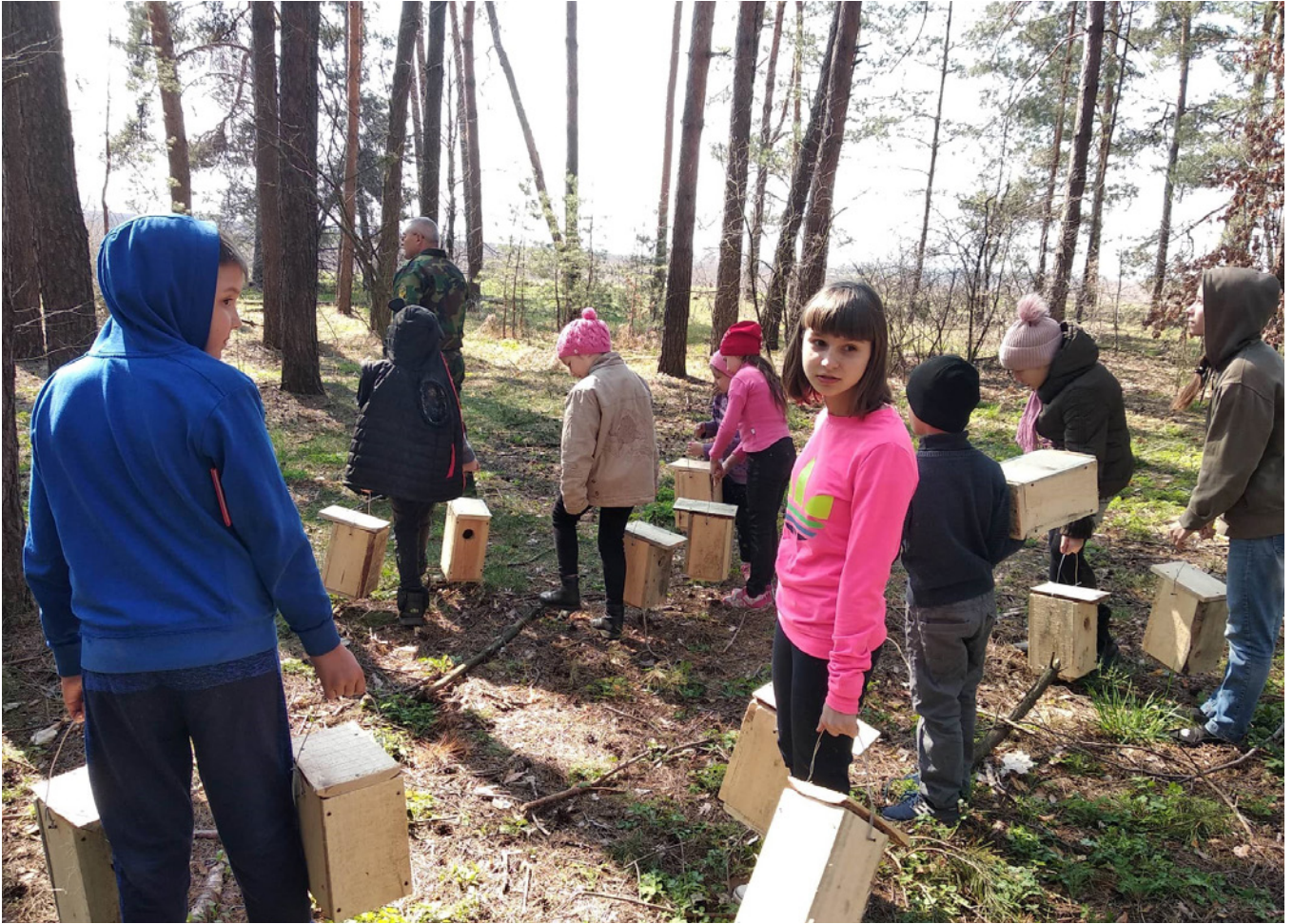
Пізнавальні уроки «Природа дихає життям» - це не лише теорія, а й практика