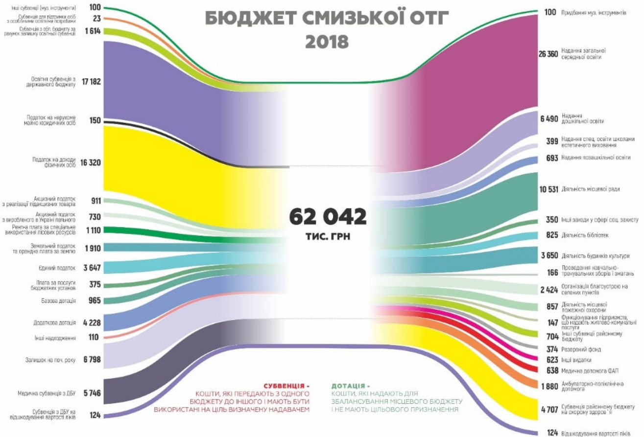
Титульна сторінка буклету та один з його розворотів: лаконічно та інформативно про головне