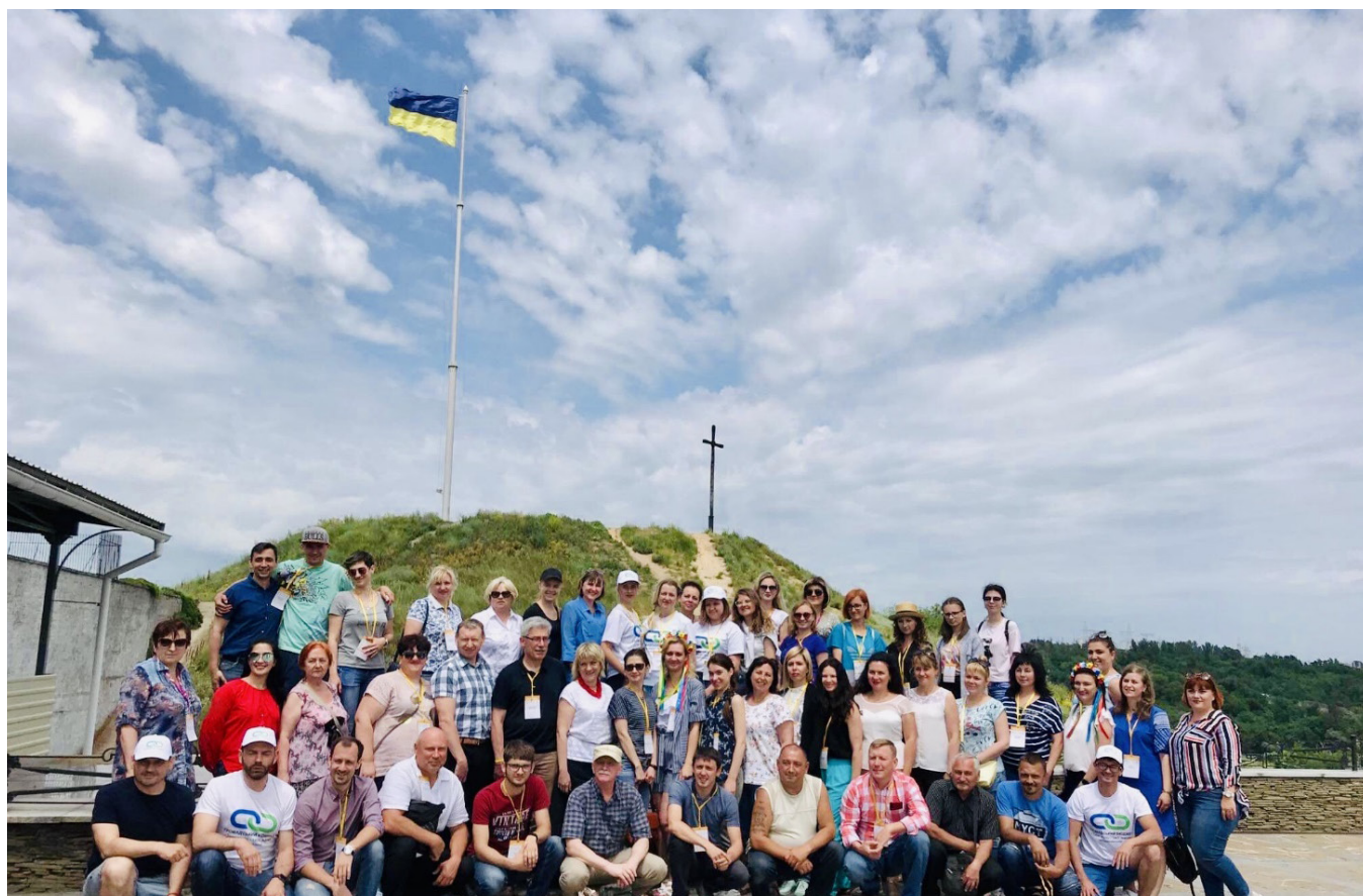
Підписання Меморандуму зі створення Асоціації учасницьких громад. 7 червня 2019 року, острів Хортиця