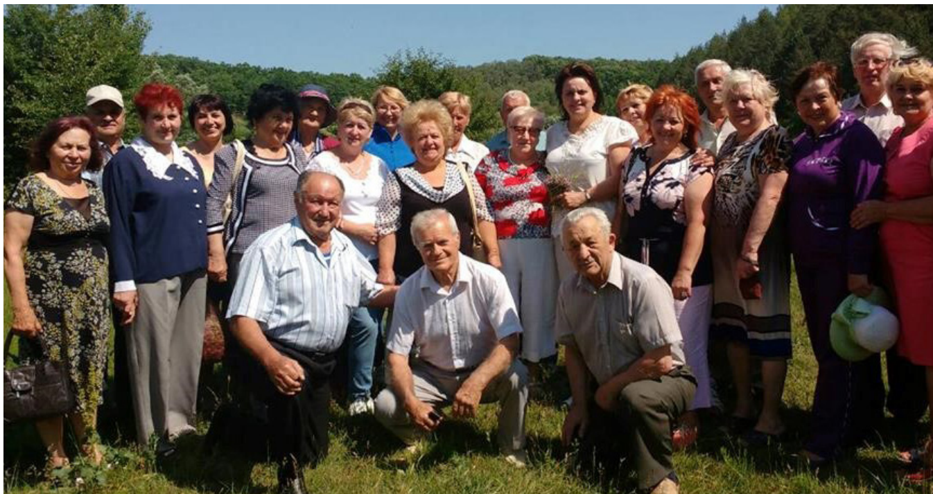
Засідання спеціалізованої громадської ради з розвитку культури при Немішайській селищній раді