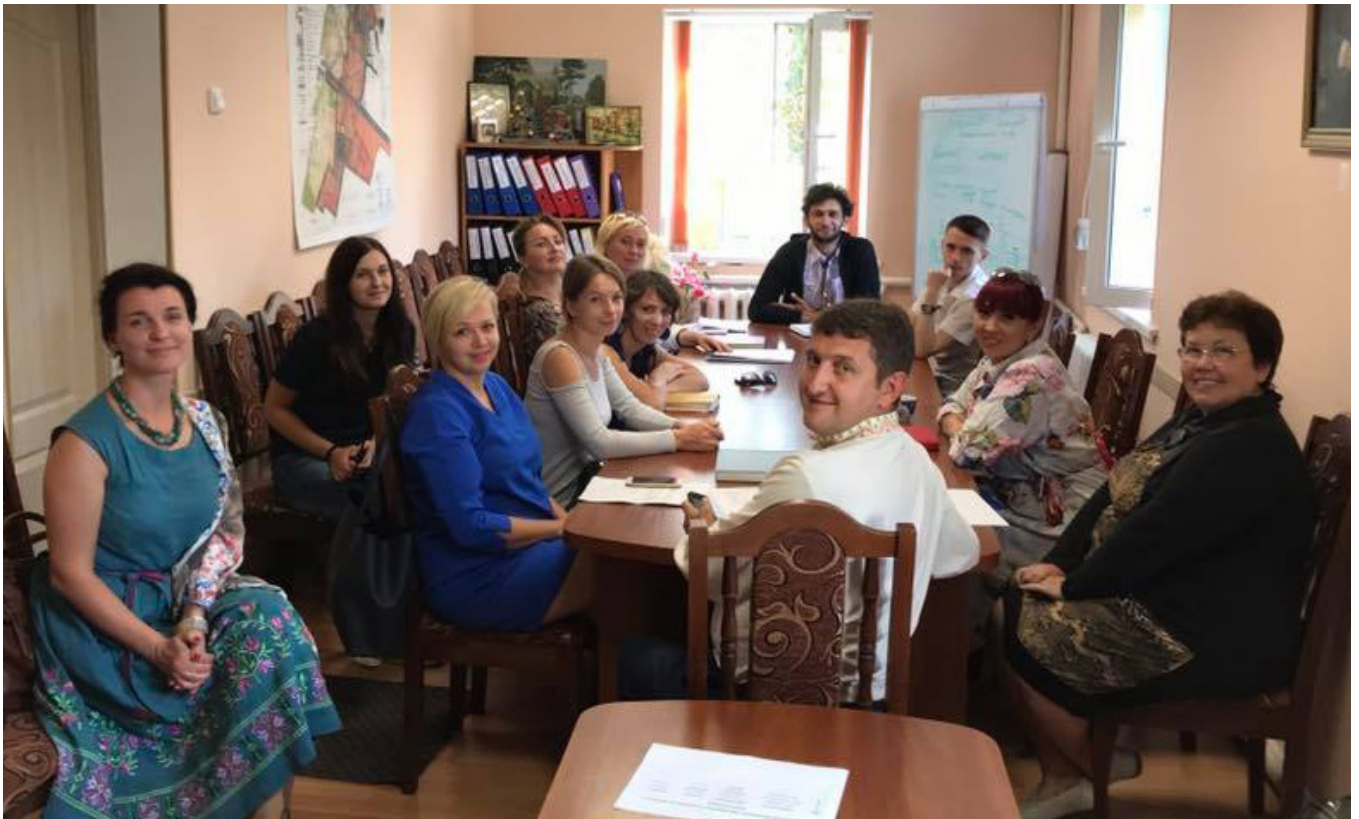
Засідання спеціалізованої громадської ради з розвитку культури при Немішаївській селищній раді