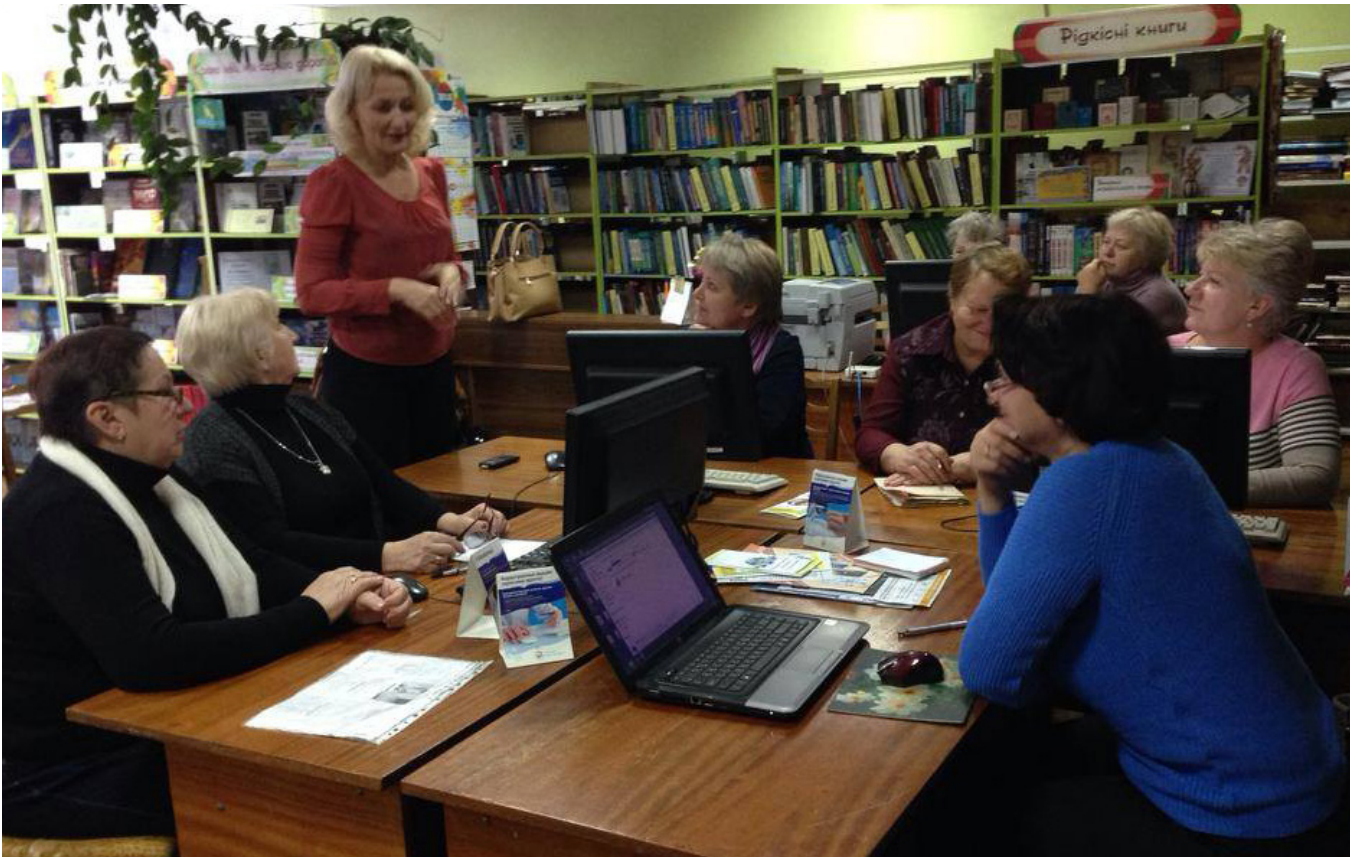
Бібліотека стає місцем, де навчаються: Заняття в Університеті третього віку