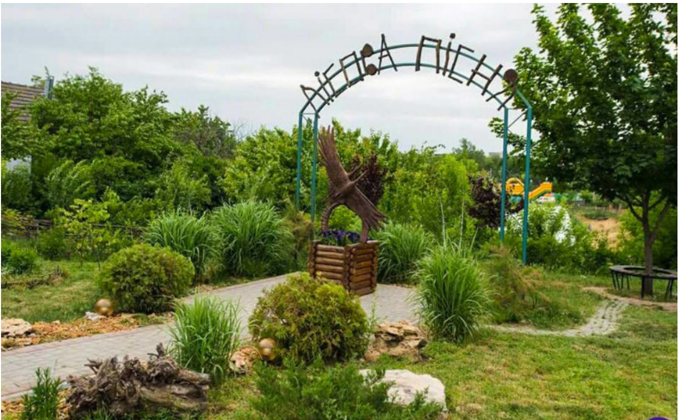
Я потопая у красі Твоїй!.. (Етнопарк «Лісова пісня»)