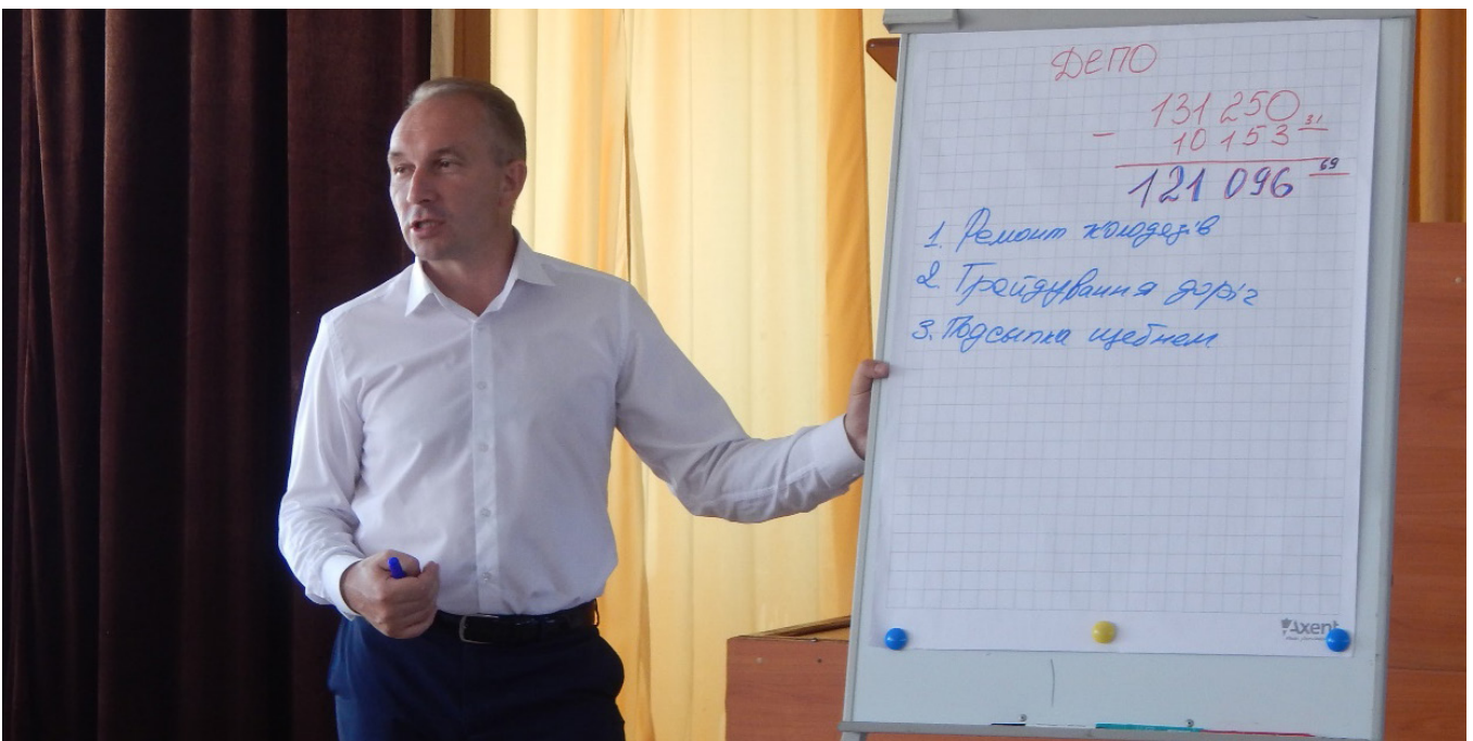
Сума, що виділена для вирішення проблем кварталу «Депю», відома. Йде збір пропозицій щодо першочергових проблем: мешканці пропонують – міський голова записує