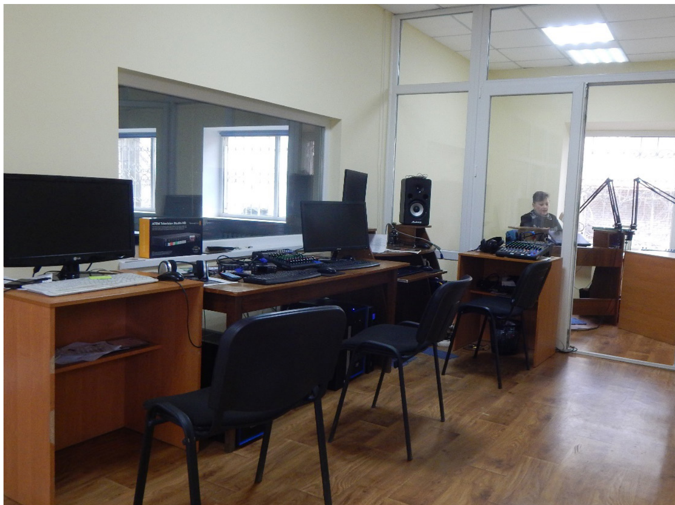
Студія Телерадіокомпанії «Тростянець»