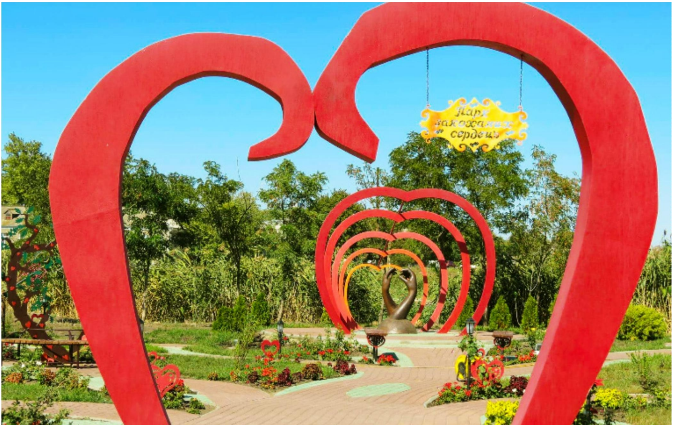
Де є любов, там є життя! (Парк Закоханих Сердечь)