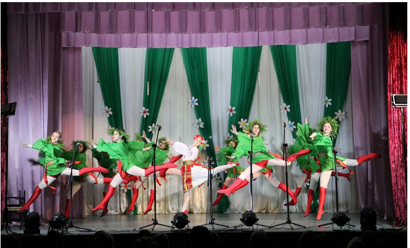
У громаді створено комфортні умови для розвитку творчих здібностей у дітей та молоді: виступ зразкової хореографічної студії «Едельвейс» «Центру культури, дозвілля, туризму і спорту Новопсковської селищної ради»