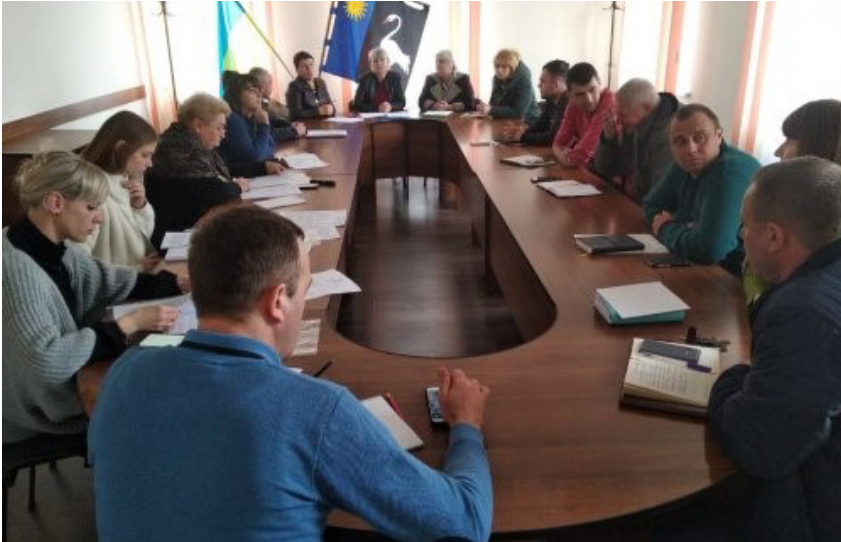
Засідання комісії міської ради з відбору проектів для фінансування в рамках Громадського бюджету