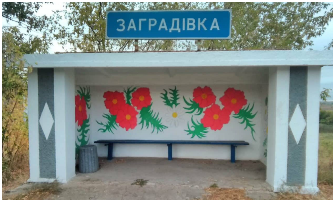
Автобусна зупинка оновлена й прикрашена за кошти громадського бюджету

завідувач сектору економічного розвитку та залучення інвестицій, Кочубеївська сільська рада ОТГ Херсонської області, тел. моб. +380683646218, е-пошта: tige1otg.ei@gmail.com