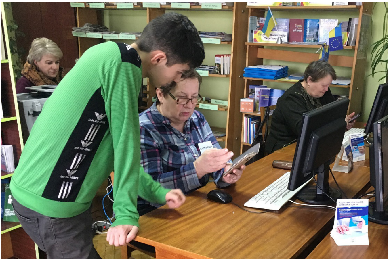
Передача досвіду від молодшого покоління старшому: освоєння сучасних гаджетів