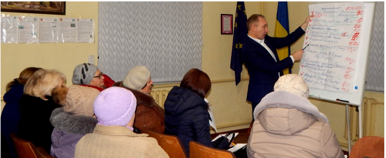
Міський голова Юрій Бова та жителі кварталу спільно аналізують проблеми території та обирають пріоритети з урахуванням можливостей міського бюджету

Заступник міського голови з питань економічного розвитку, бюджету, залучення інвестицій, торгівлі, малого та середнього підприємництва, управління комунальним майном, законності та регулювання земельних відносин, Тростянецька міська рада, Сумська область. тел.: +380662635950; факс: +380545851380; е-пошта: zlepkov@ukr.net