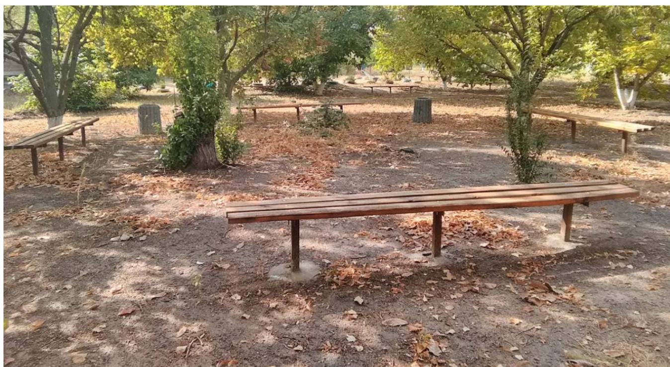
Завдяки проекту, профінансованому в рамках бюджету участі, тепер тут можна посидіти, обговорити нові ідеї та проекти