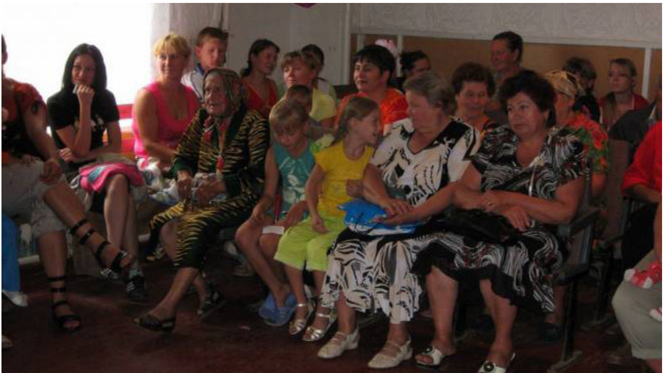
Червова, одна із дев'ятнадцяти виїзних інформаційних зустрічей в громадах: обговорюється питання щодо надання згоди громади на об'єднання в ОТГ

Про діяльність мобільної інформаційної групи навіть писала районна газета «Голос Баштанщини» (№86 за 29 вересня 2016 року)