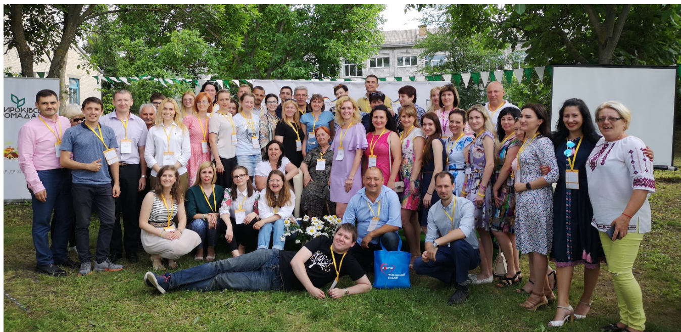
Учасники Першого східноукраїнського форуму практиків партиципaції. Широківська ОТГ Запорізької області, червень 2019 року

моб. +380961127703, е-пошта: ldonos81@gmail.com