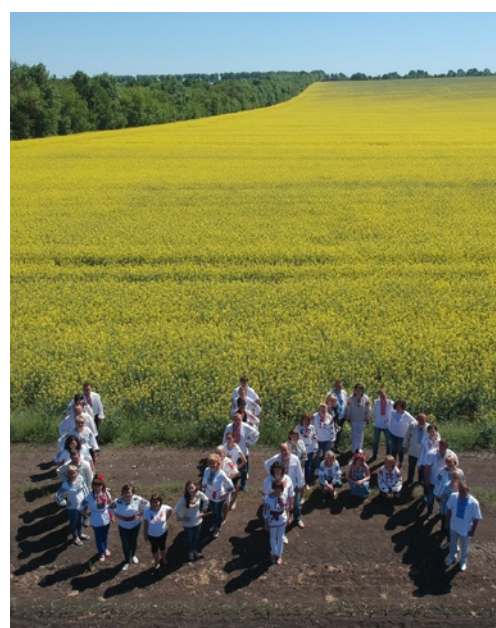
День вишиванки, 2018 рік