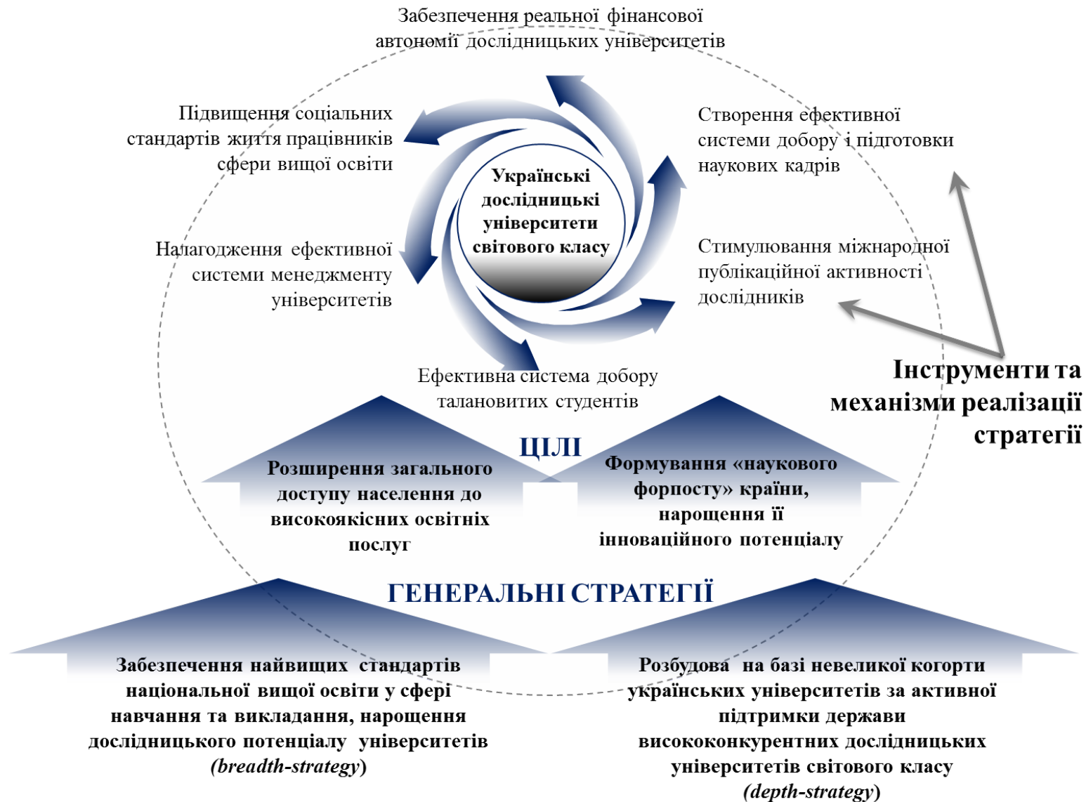
Рис. 2. Контури національної стратегії розвитку дослідницьких університетів в Україні