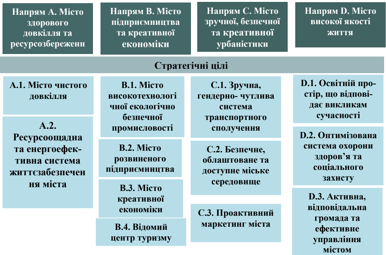
Рис. 3. Структура стратегічних напрямів і цілей Стратегії

Обрані стратегічні напрями взаємопов'язані між собою і визначають основні сфери функціонування громади в цілому, на яких необхідно концентрувати зусилля для досягнення позитивних результатів розвитку, захисту та відродження довкілля міста, підвищення конкурентоспроможності у боротьбі за інвестиції, нові робочі місця, трудові ресурси, податкові