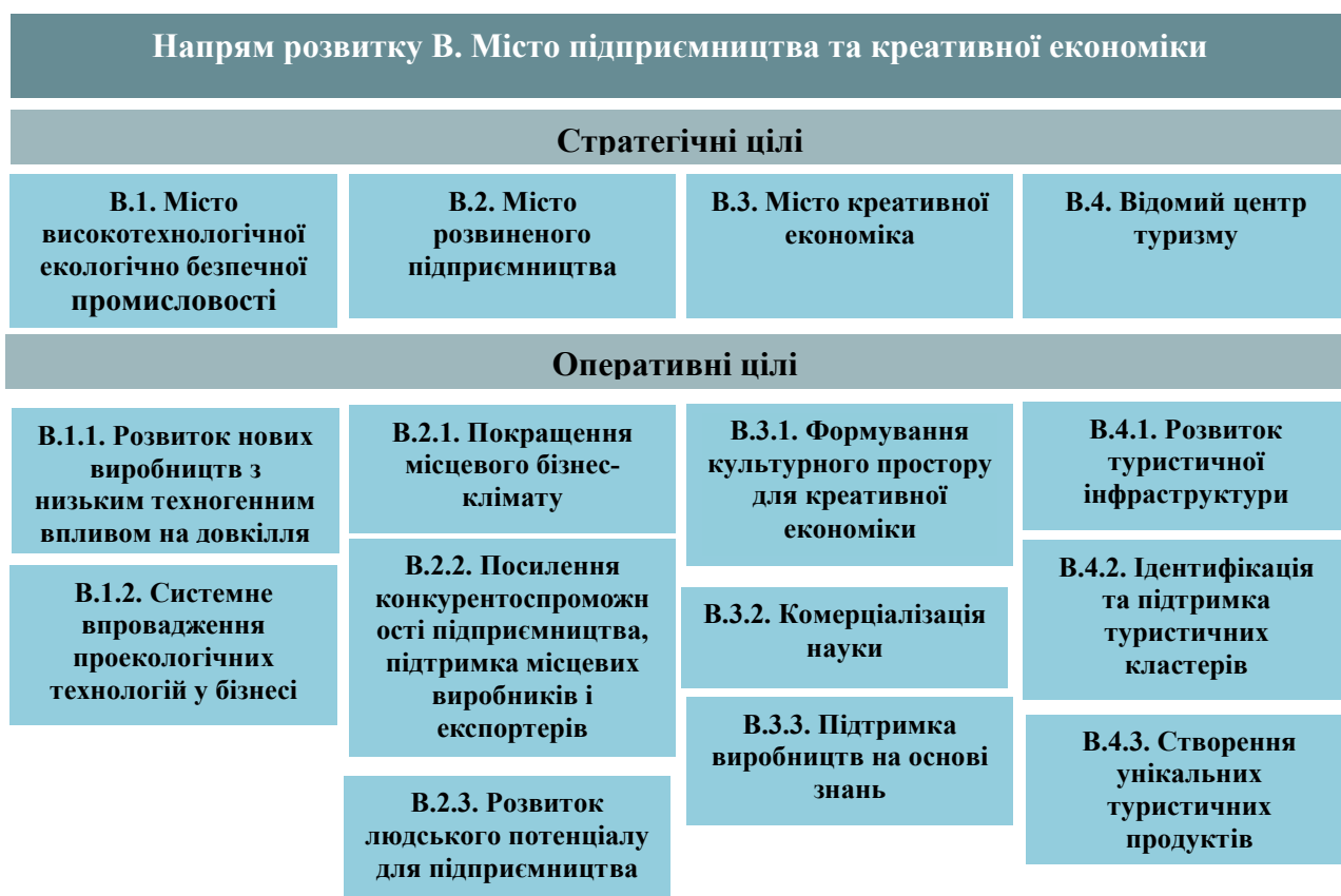
Рис. 5. Структура стратегічних і оперативних цілей за напрямом розвитку В. Місто підприємництва та креативної економіки