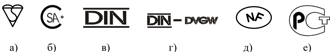
Рис. 3. Національні знаки відповідності:

Національні організації із сертифікації різних країн мають свої, встановлені відповідними нормативними документами знаки відповідності, які визначають відповідність даної продукції обов'язковим чи необов'язковим вимогам стандартів, обов'язкову чи добровільну процедуру оцінки відповідності, орган, що проводив оцінку відповідності тощо (рис. 3). У довідниках із сертифікації подано маркування, яке застосовують різні національні органи із сертифікації [26]. В Україні застосовується знак "Трилисник" (рис. 4).