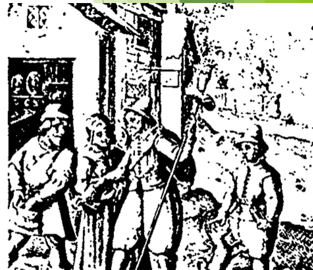
Криспен де По.