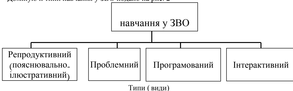
Рис. 2. Основні типи (види) навчання у ЗВО

Домінуючі типи навчання у ЗВО подано на рис. 2