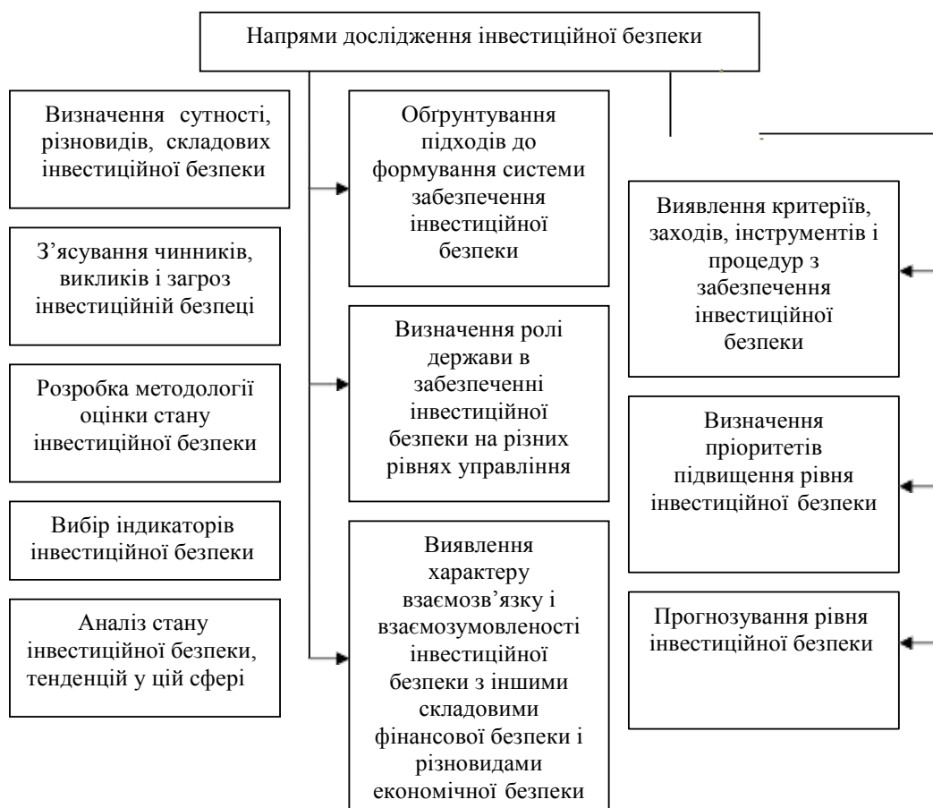
Рисунок 1.3 – Напрями дослідження інвестиційної безпеки

Питання інвестиційної політики є вкрай важливим як для кожного регіону, так і для всієї України. Зараз інвестиційний клімат погано стимулює прямі та портфельні інвестиції в країну. Для успішного залучення іноземних інвестицій треба мати стабільні та надійні підприємства з налагодженим виробництвом і готовністю конкурувати. Більшість українських підприємств сьогодні не відповідають цим вимогам, а тому не можуть стати реальним об'єктом інвестицій. Систематизуючи існуючу ситуацію, треба досліджувати напрями інвестиційної безпеки, виявляти інструменти та заходи з її забезпечення, визначати пріоритети підвищення надійності, прогнозувати рівні інвестиційної безпеки [11].