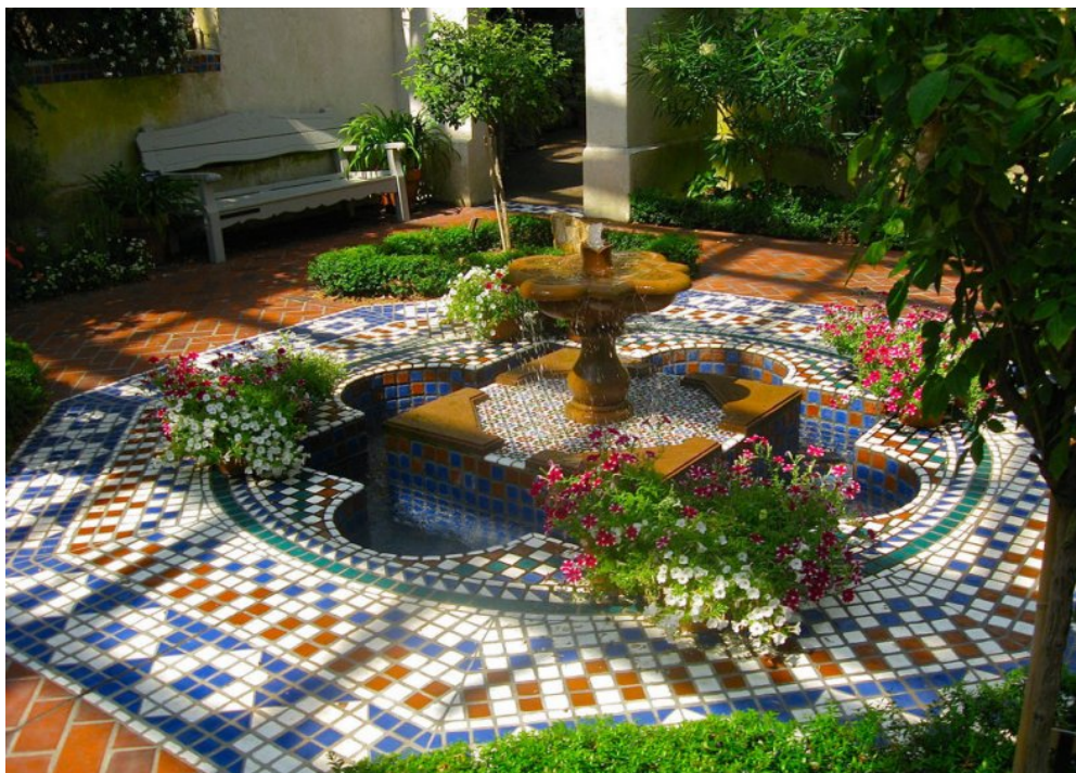
Декор саду в мавританському стилі

пізніше і став користуватися величезним попитом. Іспано-мавританський стиль використовувався як для декору садів, так і інтер'єру будинки