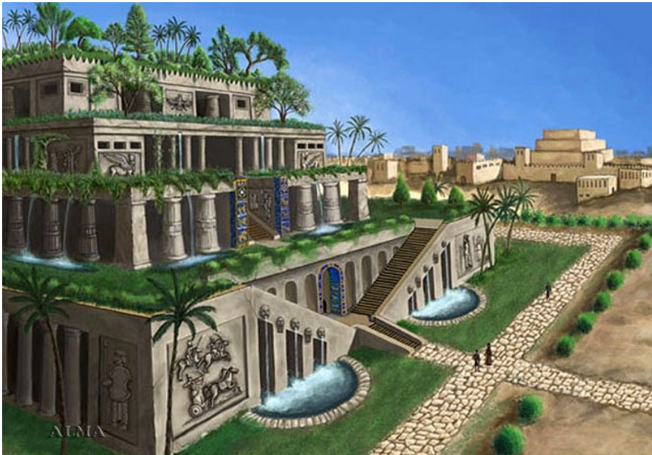
Рисунок - Висячі Сади Семіраміди

Декількома століттями пізніше сади при палацах, храмах, віллах знаті і заповідних мисливських парків виникають в Ассирії і Вавилоні . Ці сади були невеликими за розмірами, розташовувалися між житловими будинками й охоронялися високими неприступними стінами, прикрашалися великою кількістю витворів мистецтва у вигляді басейнів, скульптур, альтанок, пергол, картин. Усадах висаджували квіти. Кращим представником цих садів, а також добрим зміцненням берега Євфрату були «висячі сади».