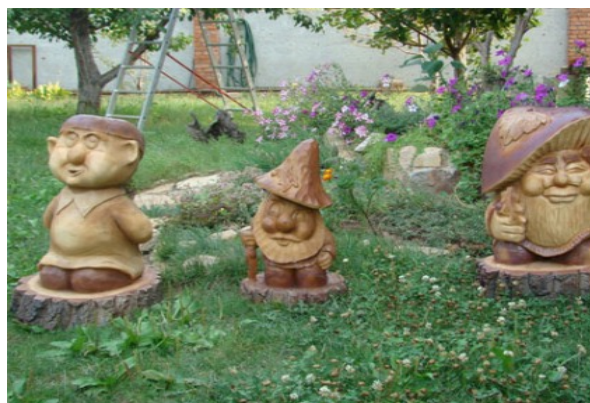
Сучасні садові скульптурки