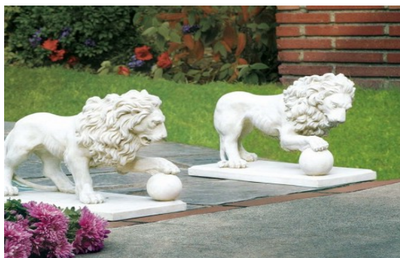
Класичні садові скульптурки