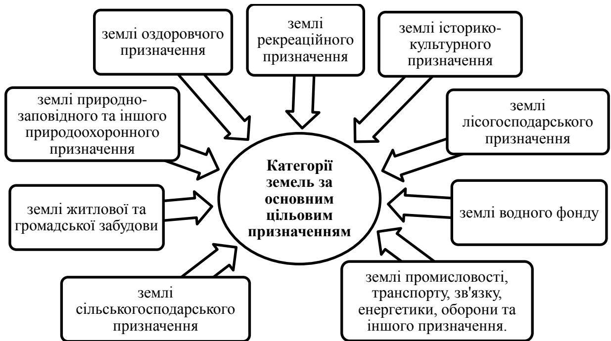
Рисунок 1.3 – Категорії земель України за основним цільовим призначенням

Кожна з перерахованих категорій розділена на кілька видів Підставою для визначення цільового призначення землі виступають рішення уповноважених органів влади. Місцевість, яка не є у володінні фізичних осіб або підприємств, вважається в запасі.