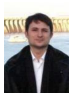
Череп О. Г. (д.е.н., проф.)