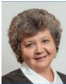
Череп А. В. (д.е.н., проф.)