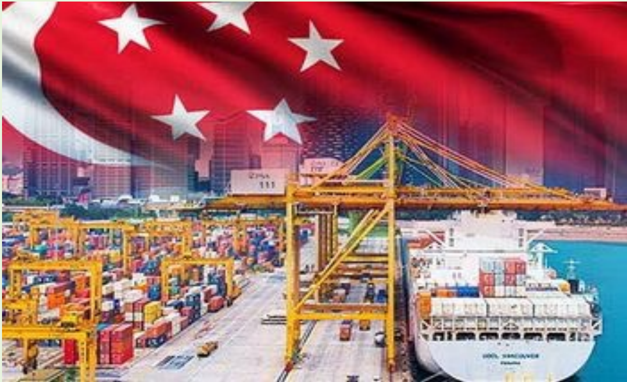
Сінгапур - «Ворота Азії»