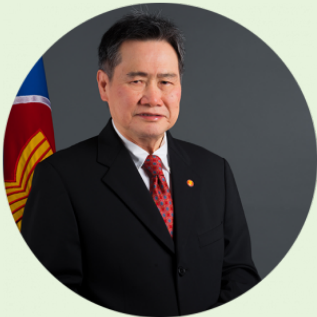
Генеральний секретар АСЕАН Лім Джок Хой (Бруней)