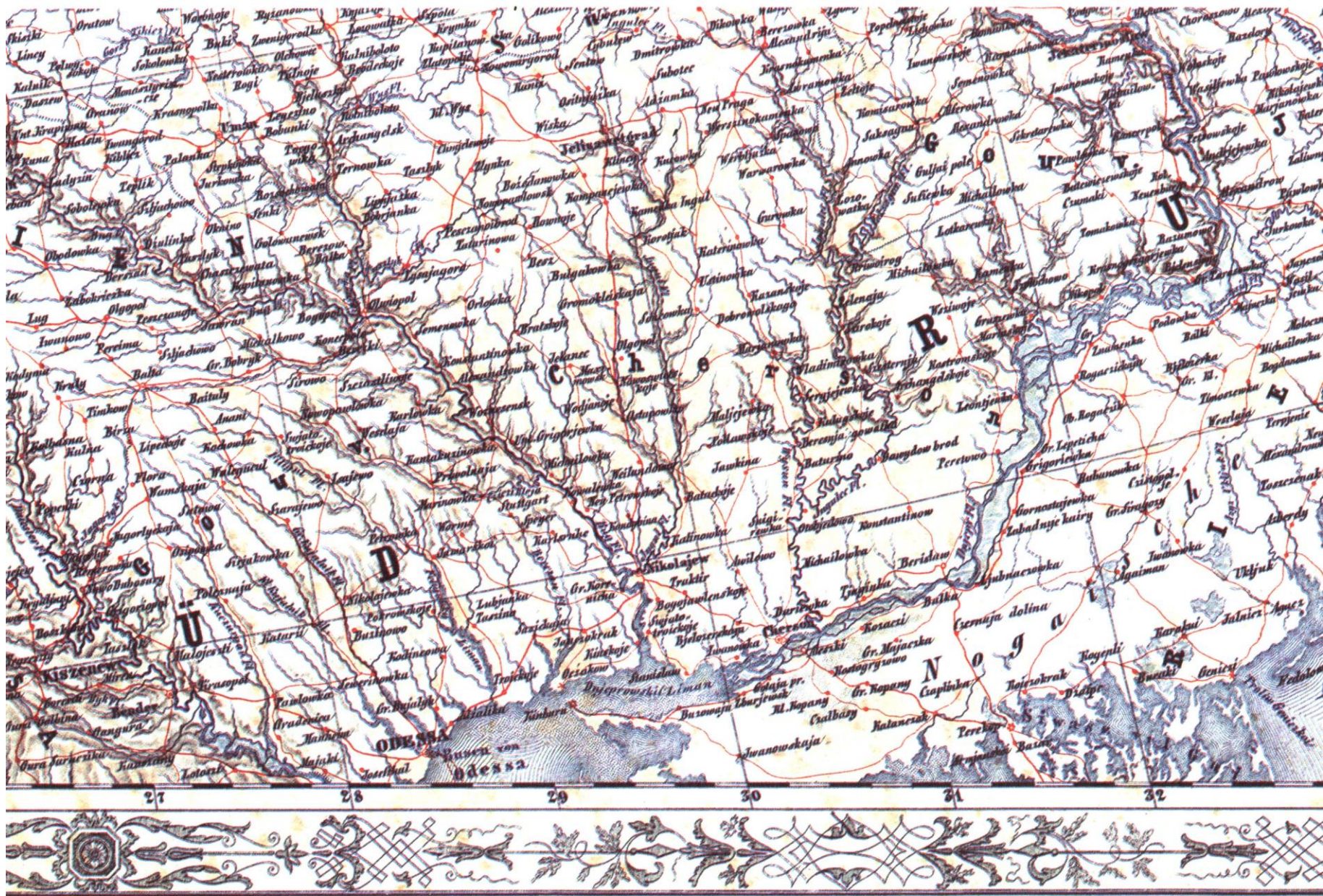
Рис. 52. Фрагмент австрійської "Генеральної карти Європи Фердинанда I" масштабу 1:2 592 000 (Відень, 1845–1847 рр.)