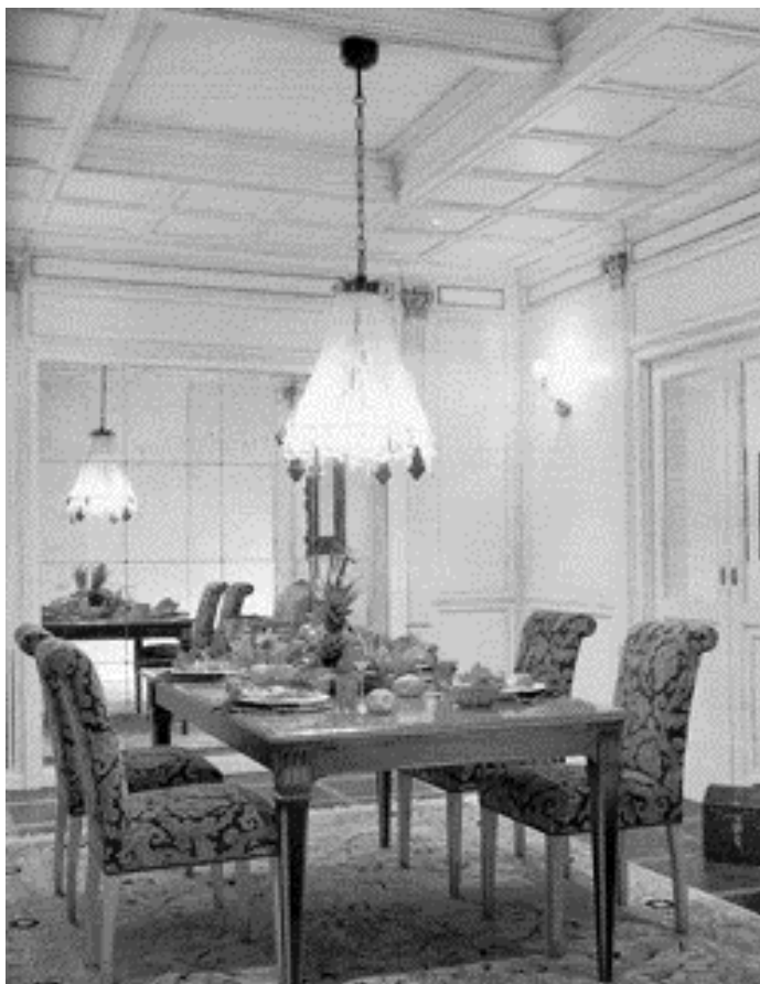
Малюнок 1.4.3 – Використання кесонної стелі, освітлення приміщення

В інтер'єри житлових будинків вводилися яскраві декоративні драпіровки і занавеси, зокрема, над ліжками, і покривала, якими останні застелялися. Для цього використовувалися різні багаті тканини, зокрема східного походження. Один із древніх письменників застосовує для опису цих тканин різні епітети — «блискучі», «багаті», «пурпурні», «темно-зелені», «заткані золотом» і інші.