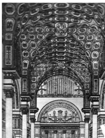
Малюнок 1.4.1 – Терми Каракалли в Римі

У багатьох монументальних спорудженнях Рима прикрашалися зводи — найчастіше кесонами квадратної, восьмигранної, ромбовидної або круглої форми з розетками в центрі. Кесони у великих спорудженнях виконувалися засобами основної цегляно-бетонної конструкції, а в невеликих — у вигляді декорації.