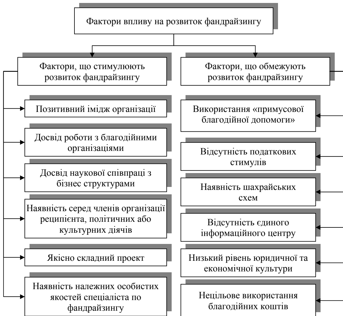
Рис. 3. Фактори впливу на розвиток фандрайзингу в Україні Примітка. Складено на основі [2,3]

Основними інструментами фандрайзингу є державне фінансування, донорська допомога, реклама, підтримка бізнесу, фандрайзингові заходи, соціальне підприємництво, крауфандинг, ендавмент та фандрайзингові портали. При цьому за рахунок бюджетних коштів фінансуються переважно проекти децентралізації та місцевого самоврядування. Залучити бюджетні кошти громадська організація може шляхом участі в грантових конкурсах, які передбачені бюджетом, якщо вона відповідає критеріям відбору учасників конкурсу. Надання грошових грантів сприяє не лише підвищенню іміджу та конкурентоздатності організації, але й вирішенню соціально значущих проблем, збільшенню добробуту населення, якості його життя, покращенню здоров'я, зростанню свідомості громадян країни.