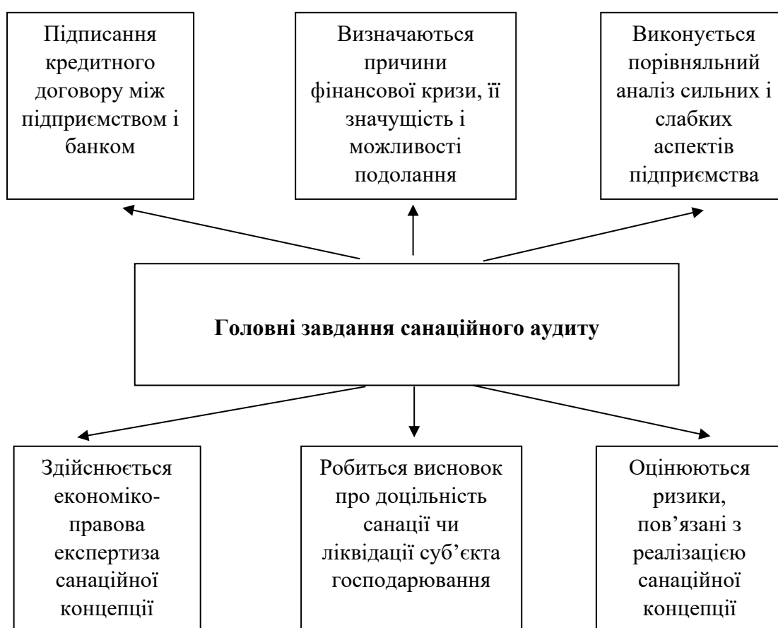
Рис. 5. Головні завдання санаційного аудиту

Санаційний аудит спрямований зробити незалежну оцінку плану санації, тобто висловити думку про оптимальність такого плану, виходячи з наявних ресурсів, сильних і слабких позицій підприємства на ринку. Тому важливо для санаційного аудиту провести власну оцінку складових плану санації, а тому видами аудиторської діяльності в даному випадку буде аудит таких об'єктів.