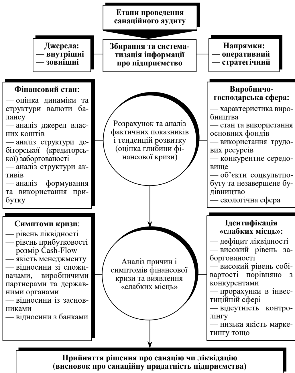
Рис. 6. Структурно-логічна схема проведення санаційного аудиту

Етапи та порядок проведення санаційного аудиту в конкретизованому вигляді характеризуються відповідною структурно-логічною схемою (рис. 6).