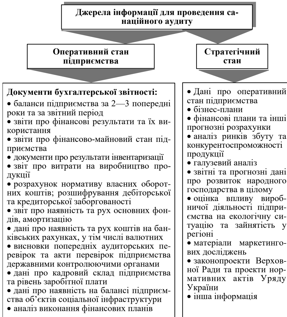
Рис. 8. Джерела інформації, використовувані у процесі санаційного аудиту

підприємства слід також використовувати зовнішні джерела, а саме: статистичні дані, що стосуються діяльності тієї чи іншої галузі та народного господарства в цілому, описовий матеріал із засобів масової інформації, висновки незалежних експертів, нормативні документи.