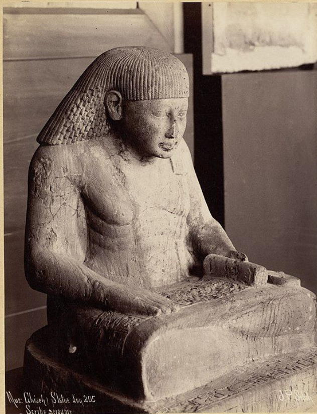
Miss. Christie Statue Jan 205 Scribe Sarcophagus