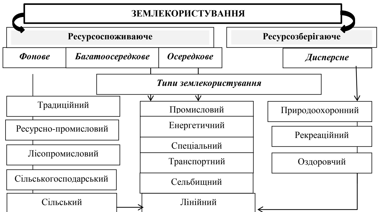
Рисунок 1 – Модель структури землекористування в Україні

Виділяють дві групи природно-ресурсного землекористування: ресурсоспоживаючу (яка змінює) і ресурсозберігаючу (ощадливу) (рис. 1).