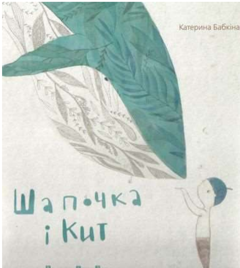
Катерина Бабкіна “Шапочка і кит”, видавництво “Старого Лева”, 2015 р.