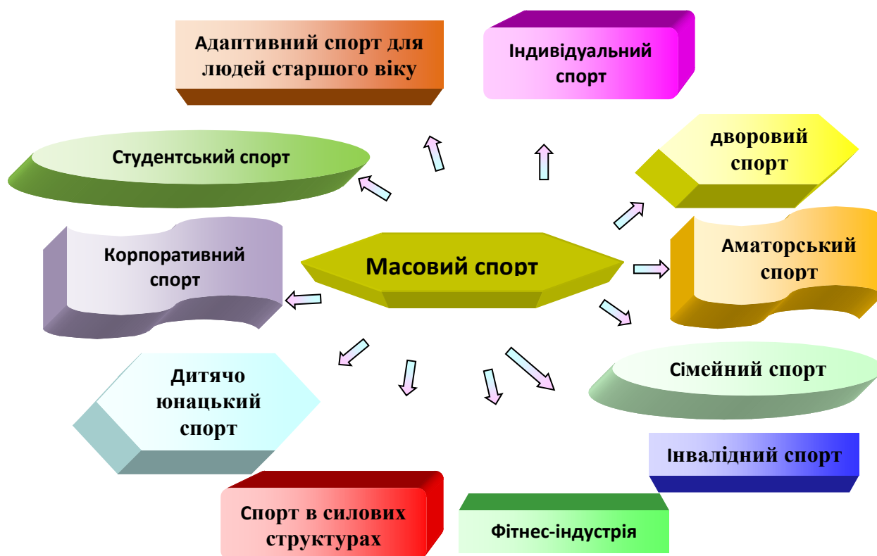
Рис.1. Складові частини масового спорту.

Якщо уявити структуру масового спорту у вигляді простої схеми, то ми побачимо, що основних елементів (які також дробляться всередині себе на окремі складові) буде одинадцять (рис.1).