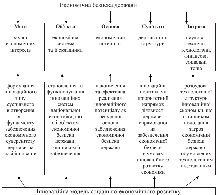
Рис. 4.2. Роль інноваційної моделі соціально-економічного розвитку в забезпеченні економічної безпеки держави

Роль інноваційної моделі соціально-економічного розвитку в забезпеченні національної економічної безпеки відображено на схемі (рис. 4.2).