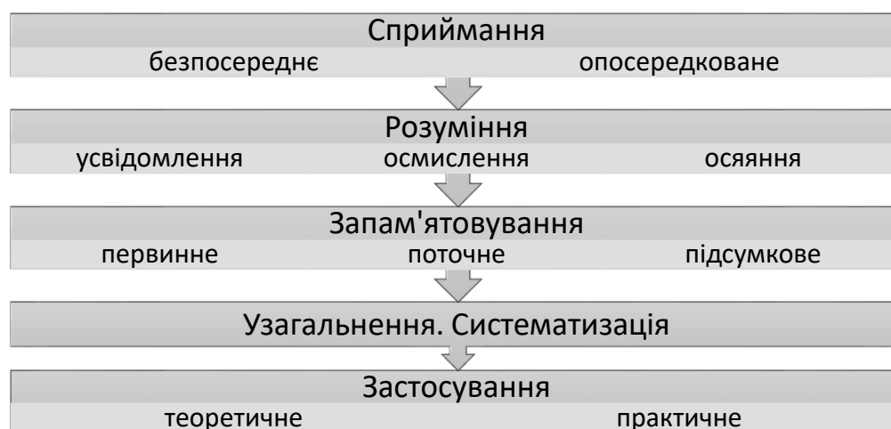
Рис. Етапи процесу сприймання

Викладання – це діяльність викладача, спрямована на управління навчально-пізнавальною діяльністю студента, яка виявляється в передаванні інформації, організації навчально-пізнавальної діяльності студентів, наданні допомоги в разі труднощів у процесі навчання, стимулювання інтересу, самостійності й творчості студентів, оцінці їхніх навчальних досягнень.