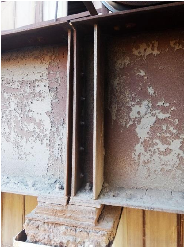
Фото 1.7. Разрушение защитного слоя бетона верхней части колонны с оголением и коррозией арматуры