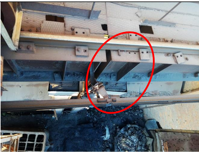
Фото 1.5 Трещина в стенке балки. Вырезы в тормозном настиле. Отсутствуют болты в узлах крепления рельса. Обрывы сварных швов в тормозном настиле