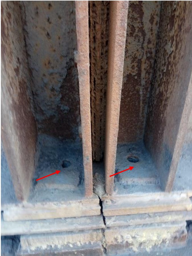
Фото 1.1. Разрушение антикоррозионного покрытия. Общая равномерная коррозия до 5%. Отсутствие анкерных болтов