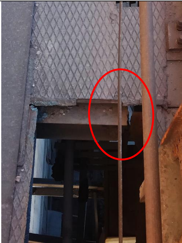
Фото 1.3. Вырезы в тормозном настиле. Обрыв по стенке балки тормозного настила