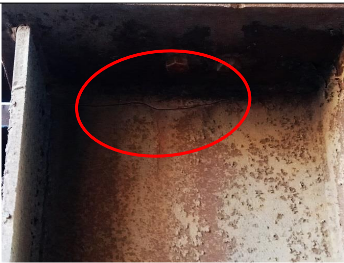
Фото 1.9 Трещина в стенке балки. Разрушение антикоррозионного покрытия. Общая равномерная коррозия до 5%.