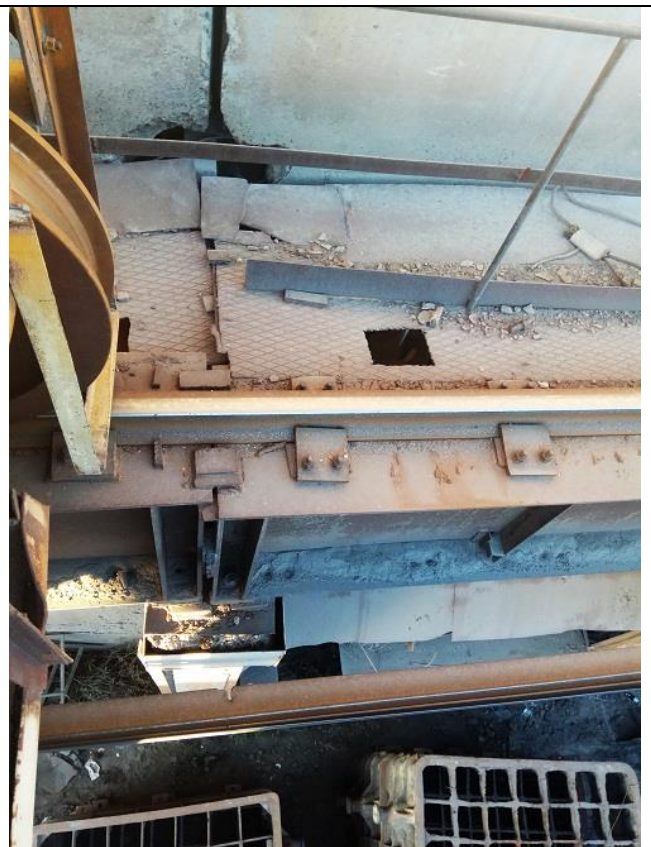
Фото 1.6.. Отклонение верхнего пояса подкрановой балки. Вырезы в тормозном настиле. Обрывы сварных швов в тормозном настиле