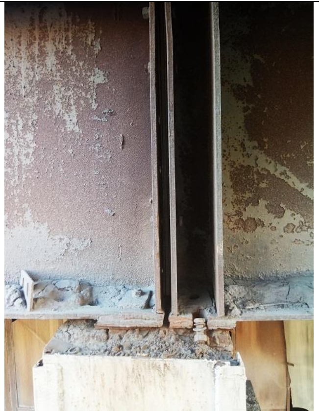
Фото 1.8 Разрушение защитного слоя бетона верхней части колонны с оголением и коррозией арматуры. Отсутствие анкерных болтов