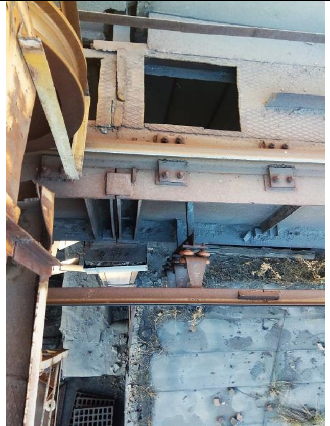
Фото 1.2 Вырезы в тормозном настиле. Обрывы сварных швов в тормозном настиле