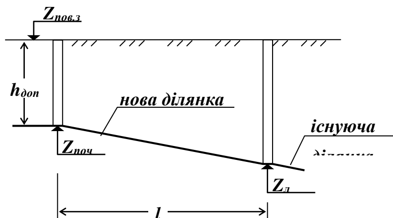
Рисунок 6.3 - Схема підключення нової ділянки до існуючої мережі

Ця задача в залежності від того, що доцільніше перевіряти, може зводитись до перевірки таких умов (рис. 6):