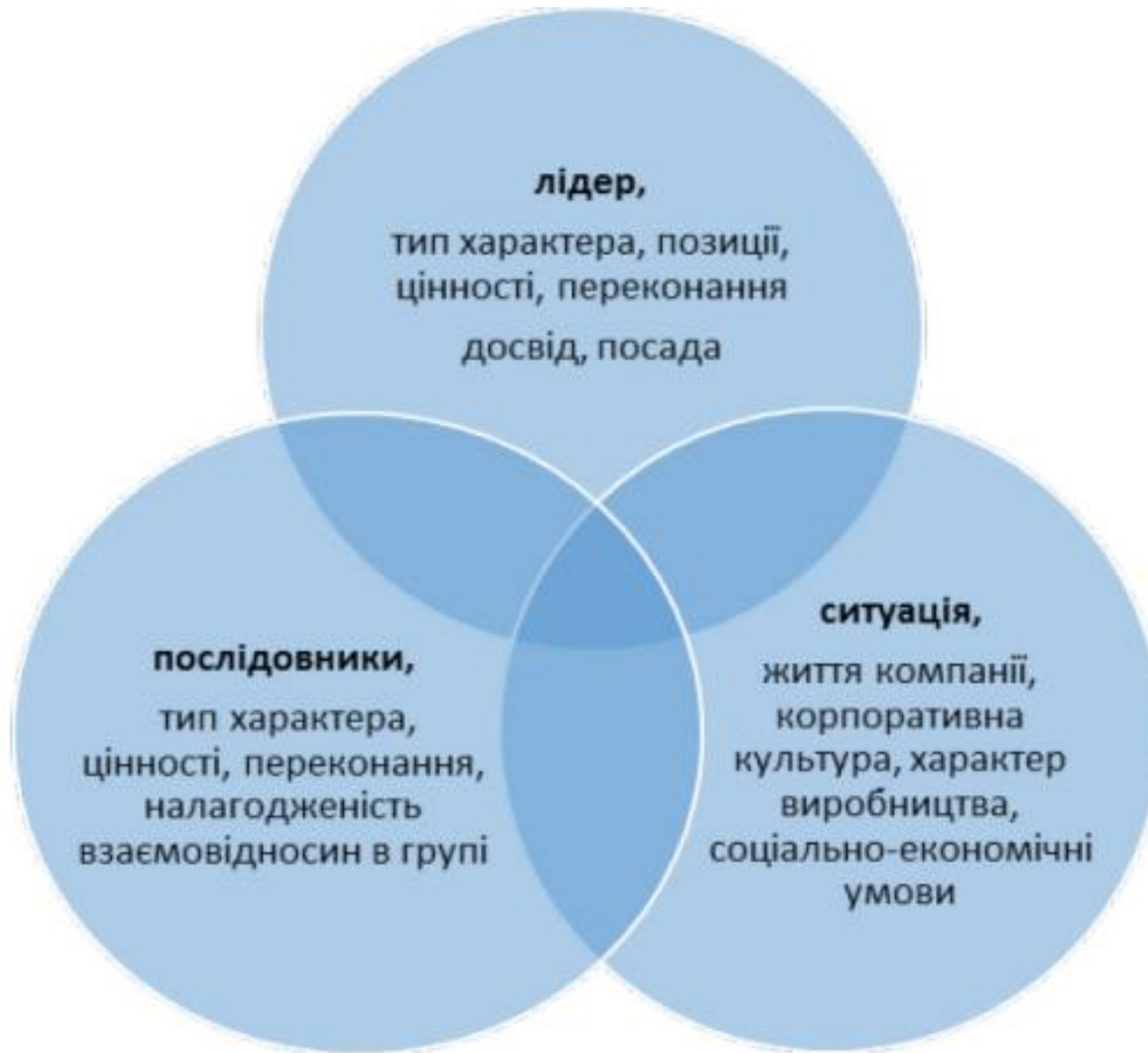
Рис.3 Складові моделі взаємодії