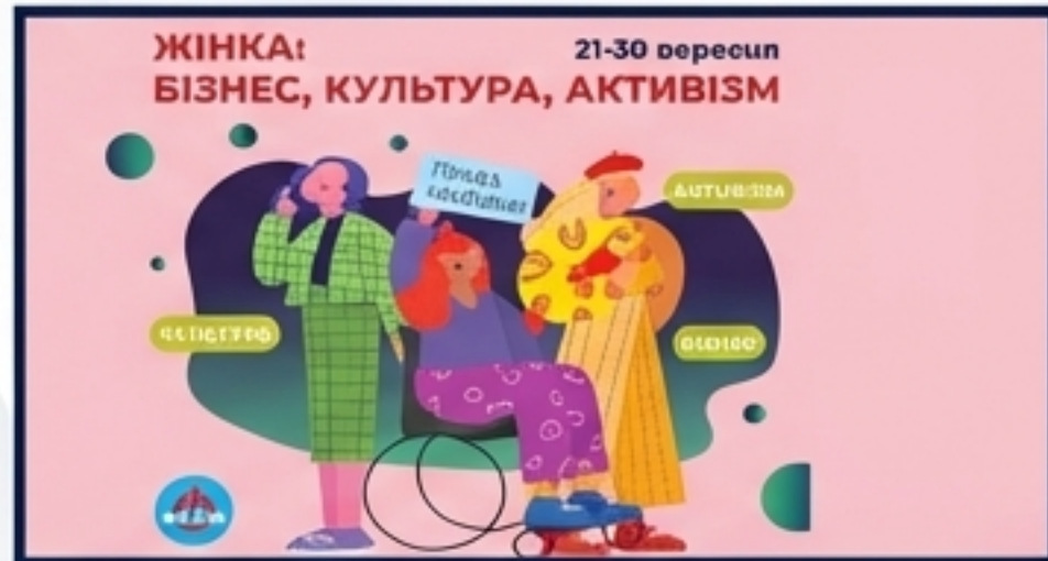
Фестивалі інклюзії та кампанії #SVOYA