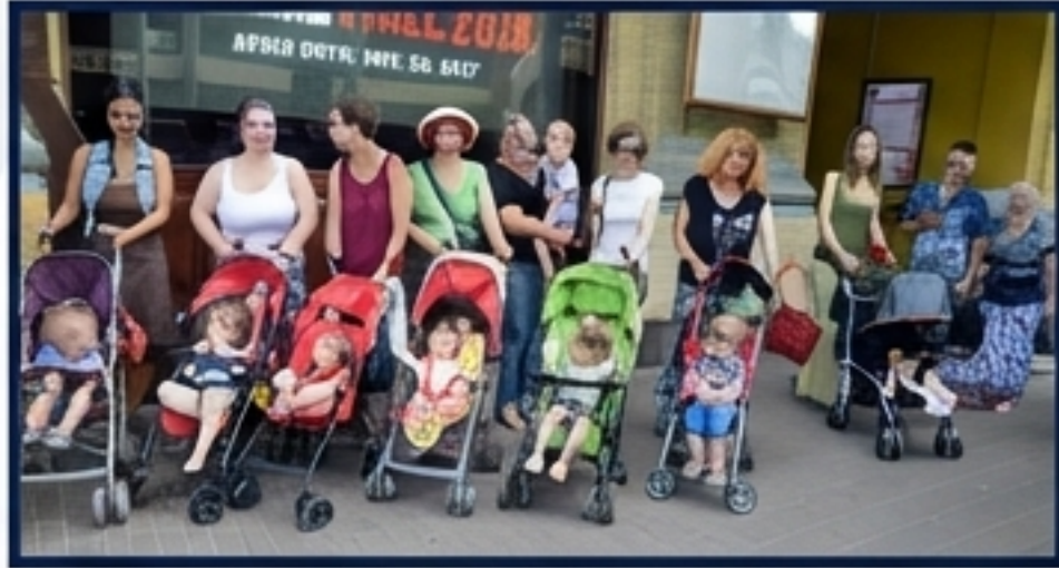
Київ — дружній для батьків і малюків