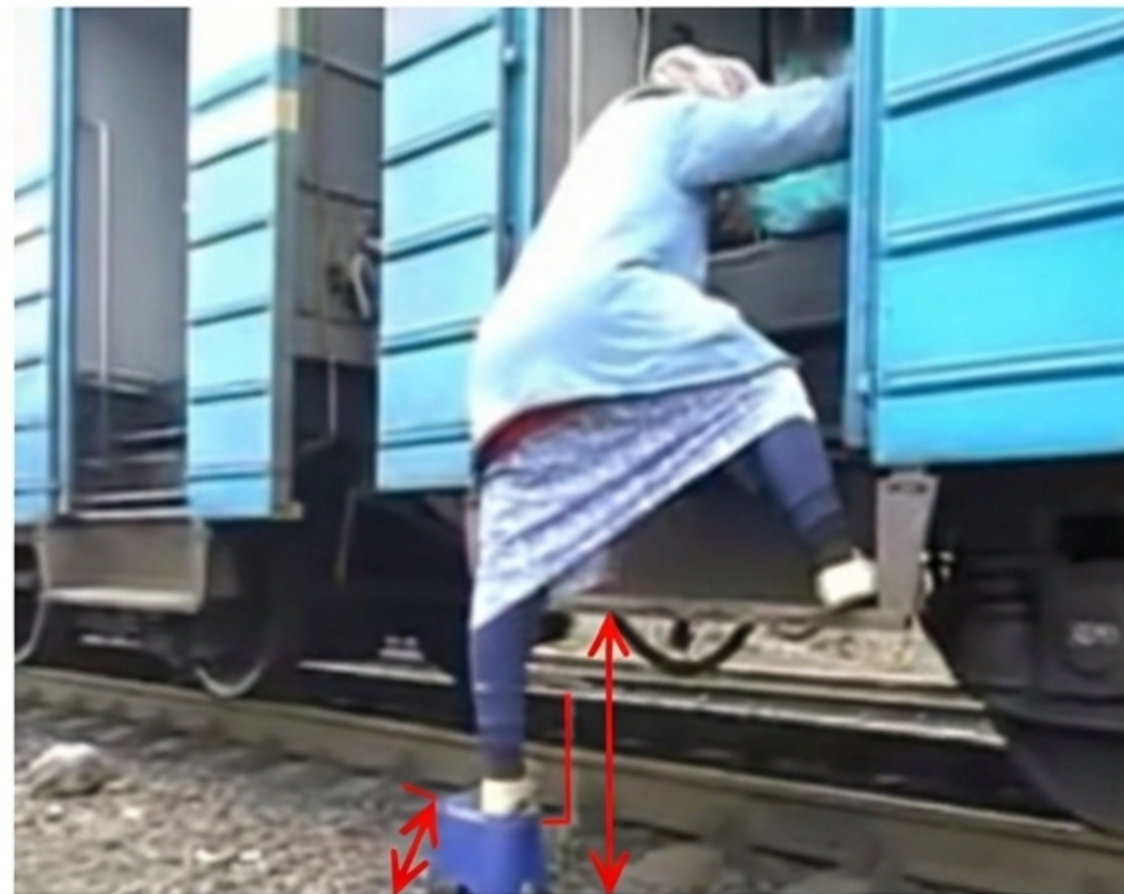
«Доступність регулюється нормами». Запоріжжя: посадка в електричку за допомогою звичайного відра/стільця.