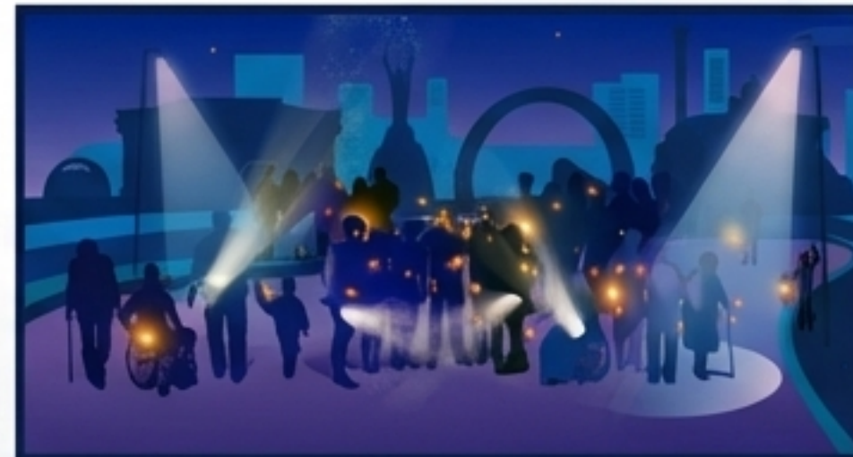
Lights for Rights — акція видимості

Суспільство вже формує запит на різноманіття. ЗМІ мають пояснювати, що усунення бар'єрів служить інтересам усього суспільства.