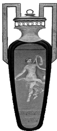
Малюнок 1.3.2- У побуті велике поширення одержали вази.

У побуті одержали велике поширення дерев'яні скрині для збереження одягу, що замінювали собою шафи. Грецькі меблі відрізнялися в цілому простотою конструкції і майстерно обробленими деталями.