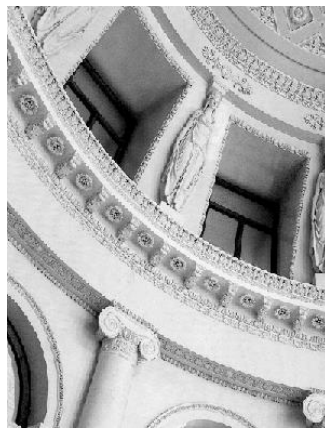
Малюнок 1.3.3– Орнамент у грецькому стилі інтер'єрів

Грецька архітектура відрізнялася великою правдивістю й логічністю формоутворення. Виразність споруджень, у тому числі інтер'єрів, визначалася насамперед тектонічною чіткістю конструктивної основи, обробленої й доповненої майстерно пластичними, орнаментальними й колірними засобами.