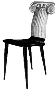
Малюнок 1.3.6– Предмети грецького стилю у сучасному інтер'єрі