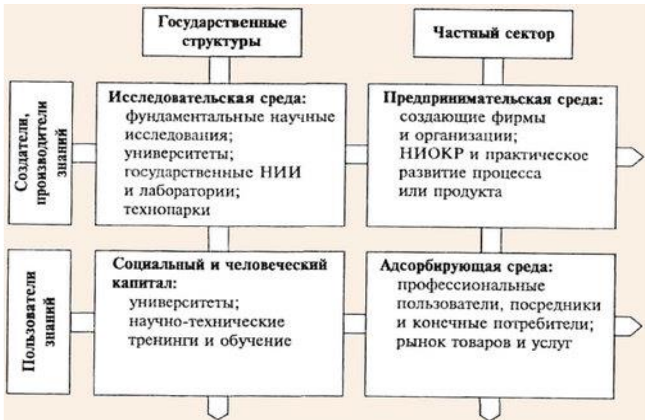
Рисунок 4.1 - Схема національної інноваційної системи

Розвиток національного інноваційного механізму - масштабне і складне завдання, вирішити яке неможливо без добре продуманих і погоджених ефективних дій з боку держави, економічної і наукової спільноти.