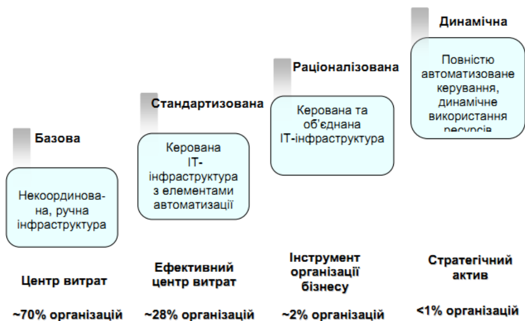
Рис. 5.3. Послідовність чотирьох рівнів технологічної зрілості

Модель ІО є послідовністю чотирьох рівнів (або фаз) поступово зростаючої технологічної зрілості: "Базовий", "Стандартизований", "Раціоналізований" та "Динамічний" (рис. 5.3).