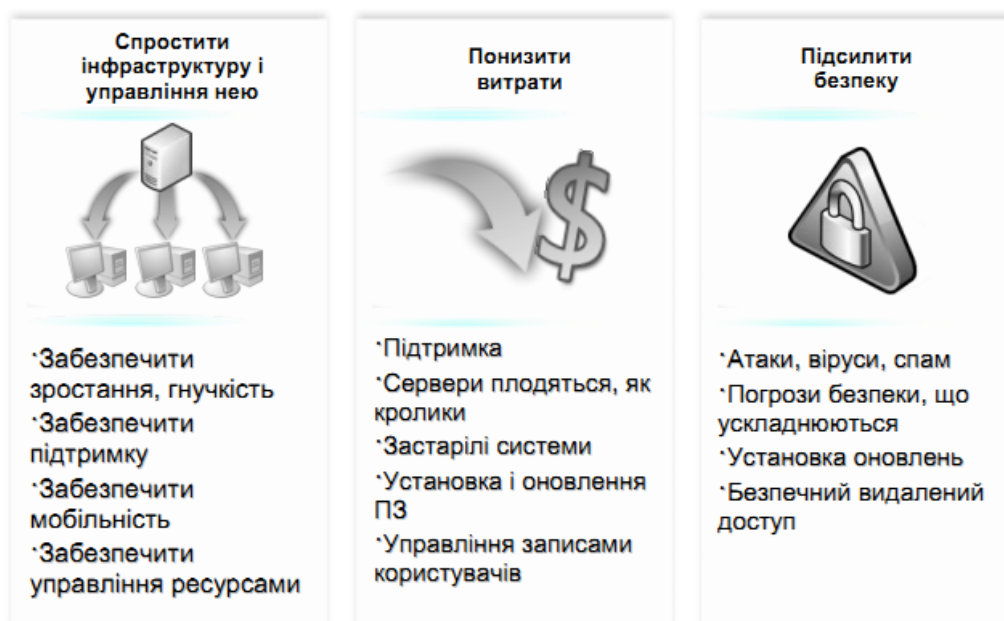
Рис. 5.2. Типові задачі оптимізації інфраструктури

Мета ІО – допомогти клієнтам зрозуміти значення інвестицій в ІТ-інфраструктуру, перетворити її на стратегічний ресурс, який надасть компаніям потрібну гнучкість, і створити інфраструктуру для бізнесу, орієнтованого на людей (people ready business). Орієнтований на людей бізнес, компанія та інфраструктура адаптуються до умов діяльності. Вони дають змогу розробляти нову продукцію й послуги швидко та з незначними витратами, об'єднуючи людей, інформацію та бізнес-процеси для швидкого реагування на ринкові тенденції та усунення низької продуктивності. Оптимізована ІТ-інфраструктура, яка розроблена згідно з ІТ-стандартами і діє ефективно й продуктивно, допомагає забезпечити відповідність ІТ-стандартам, досягти зменшення витрат, посилення безпеки й зниження ризику для оточення й користувачів (рис. 5.2).