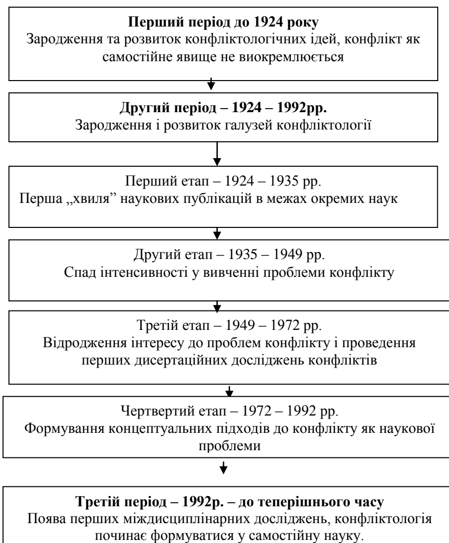
Рис.1 Періодизація історії вітчизняної конфліктології.