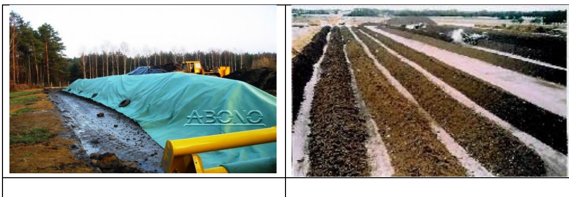
Рисунок 8.1 – Компостування відходів агропромислового виробництва

У процесі примусової біодеструкції складних компонентів твердих целюлозовмісних відходів з погляду біотехнології проходить твердофазна ферментація .