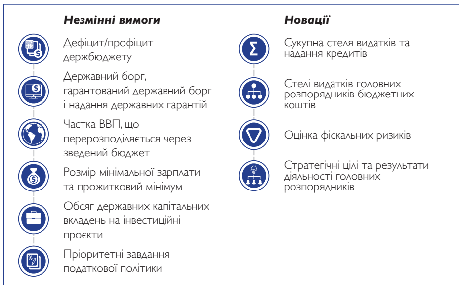
Рис. 1. Зміст Бюджетної декларації

Зміст Бюджетної декларації суттєво відрізняється від Основних напрямів бюджетної політики. Окрім положень, які щорічно визначалися в Основних напрямках бюджетної політики (дефіцит або профіцит державного бюджету, обсяги державного та гарантованого боргу, темпи зростання ВВП, розмір мінімальної заробітної плати та прожиткового мінімуму, основні завдання податкової політики тощо), з'явилися нові. Це загальні граничні показники витратків на три роки, граничні показники витратків для кожного з головних розпорядників, це цілі державної політики у відповідній сфері та показники їх досягнення за результатами попереднього бюджетного періоду, очікуваних у поточному бюджетному періоді та прогнозних на середньостроковий період у межах визначених граничних показників, оцінка фіскальних ризиків і проведення оглядів витратків, прогнози місцевих бюджетів тощо.