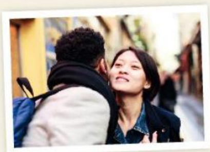
Faire la bise