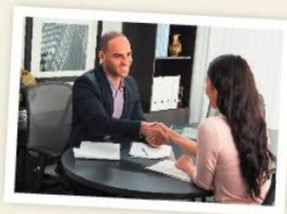
Serrer la main